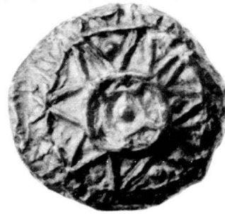
Abb. 2: Elektron-Halbstater, London, B.M. Vs. Ohne Mst.

Ein Elektron-Halbstater milesischen Münzfusses im British Museum 7 ( Abb. 2 ) besitzt auf seiner Vorderseite ein achtstrahliges Sternornament, das kunsthistorisch eindeutig zu fassen ist. Es ist, wie wir an anderer Stelle ausführlicher darlegen konnten, 8 ein charakteristisches Ornament des ausgehenden geometrischen Stils, das nur in dieser Periode Geltung hatte und später in der orientalisierenden Epoche nicht mehr nachzuweisen ist. 9 Keramik und Metallkunst nahmen dabei aufeinander Einfluss. Rhodische Goldanhänger zeigen das Ornament in verschiedenen Variationen. Häufig ist es im ostgriechischen Bereich, so auf Goldanhängern aus Kamiros und Exochi, zu finden. 10 Deren orientalische Vorbilder hat man längst erkannt: es sind jene Stern- und Sonnenscheiben, wie sie im Vorderen Orient vor allem im 2. Jahrtausend v. Chr. weite