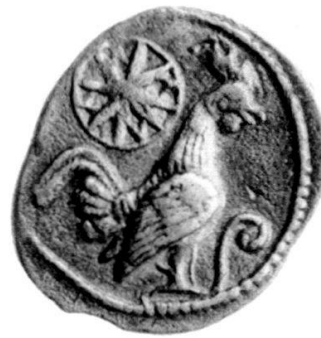
Abb. 5: Dikaia, Tetrobol, Silber, London, B.M. Vs. Mst. 2:1.

Einen Stern mit acht Strahlen, eingefasst in einen Perlkreis, finden wir auch auf Münzen der thrako-makedonischen Städte. Auf den Dekadrachmen der Derronen 33 , die ein Ochsengespann zeigen (Abb. 4), ist er nicht kleines Beizeichen, sondern prangt über dem Ochsengespann, gleichsam die obere Bildhälfte des Münzbildes füllend. Zu