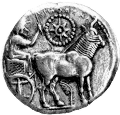
Abb. 4: Derronen, Dekadrachmon, Silber, Sofia, Archäol. Mus. Inv.-Nr. 8739; aus Gold der Thraker (1979), Nr. 509. Vs. Ohne Mst.

Auf unsere zu Beginn zitierte Homerstelle nimmt auch H. Kyrieleis 32 in seiner Studie über die Sternsymbolik hellenistischer Herrscherbildnisse Bezug, in welcher er eindrucksvoll nachweist, dass das Apotheosesymbol des über dem Kopf stehenden Sternes von den Römern in ihre eigene Bildkunst übernommen wurde: «Dass im Bild des Sterns Göttliches dem menschlichen Auge sichtbar werden kann, scheint schon früh, unabhängig vom astronomischen Sternenglauben, verbreitete Vorstellung gewesen zu sein. So nimmt beispielsweise im homerischen Apollonhymnus der Gott die Gestalt eines Sternes an, als er das Schiff der Kreter verlässt.»