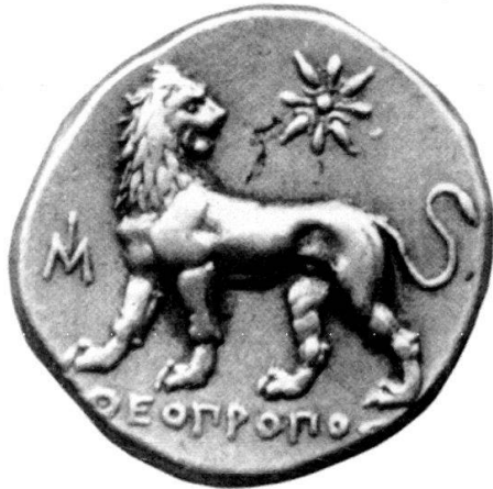
Abb. 1: Milet, Tetradrachmon; Privatbesitz. Rs. Ohne Mst.

Dass mit diesem achtstrahligen Stern tatsächlich die Sonne gemeint ist, 4 wurde in der jüngsten Monographie über die Münzprägung Milets bestritten. 5 B. Deppert-Lippitz sieht in ihm lediglich die Umwandlung jener Rosette, die die archaischen Münzen auf ihrer Rückseite trugen, einen Zusatz wie das Stadtmonogramm, ohne Bezug zum Löwen. 6 Die folgenden Ausführungen mögen einen klärenden Beitrag zu diesem Deutungsproblem liefern.