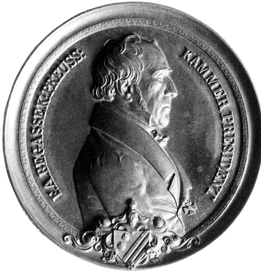
Abb. 15: HFB, F.A. Begasse, o.J. (um 1835?) Guss, Bronze, 91 mm