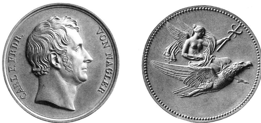
Abb. 11: HFB, Prägung zu Abb. 10 mit abweichender Gestaltung, 1835 Kupfer, 41 mm