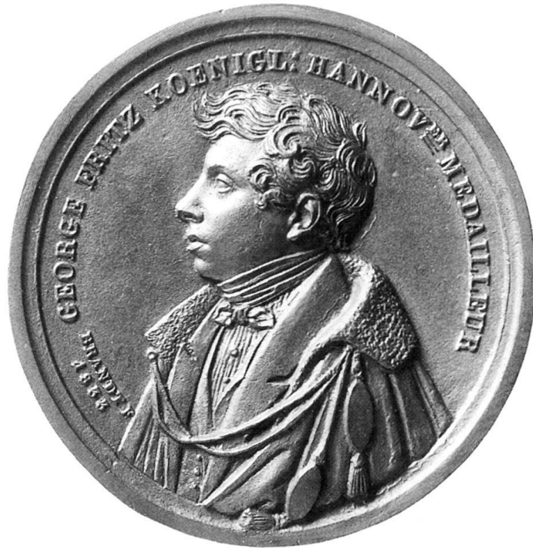
Abb. 13: HFB, George Fritz, 1833 Guss, Bronze, 78 mm