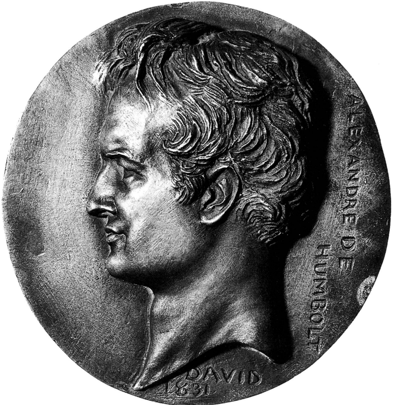
Abb. 6: David d'Angers, Alexander von Humboldt, 1831 Guss, Bronze, 155 mm

Heinrich Bolzenthals (1796–1870), der als Kustos des Königlichen Münzkabinetts für neuzeitliche Münzen und Medaillen wie kein anderer die Medailleure Berlins kannte und beurteilen konnte, würdigte den Aufschwung der Medaillenkunst in Berlin durch Brandt. Er hätte sichtbar sowohl eine Steigerung der Anforderungen wie auch der Leistungen bewirkt 8 .