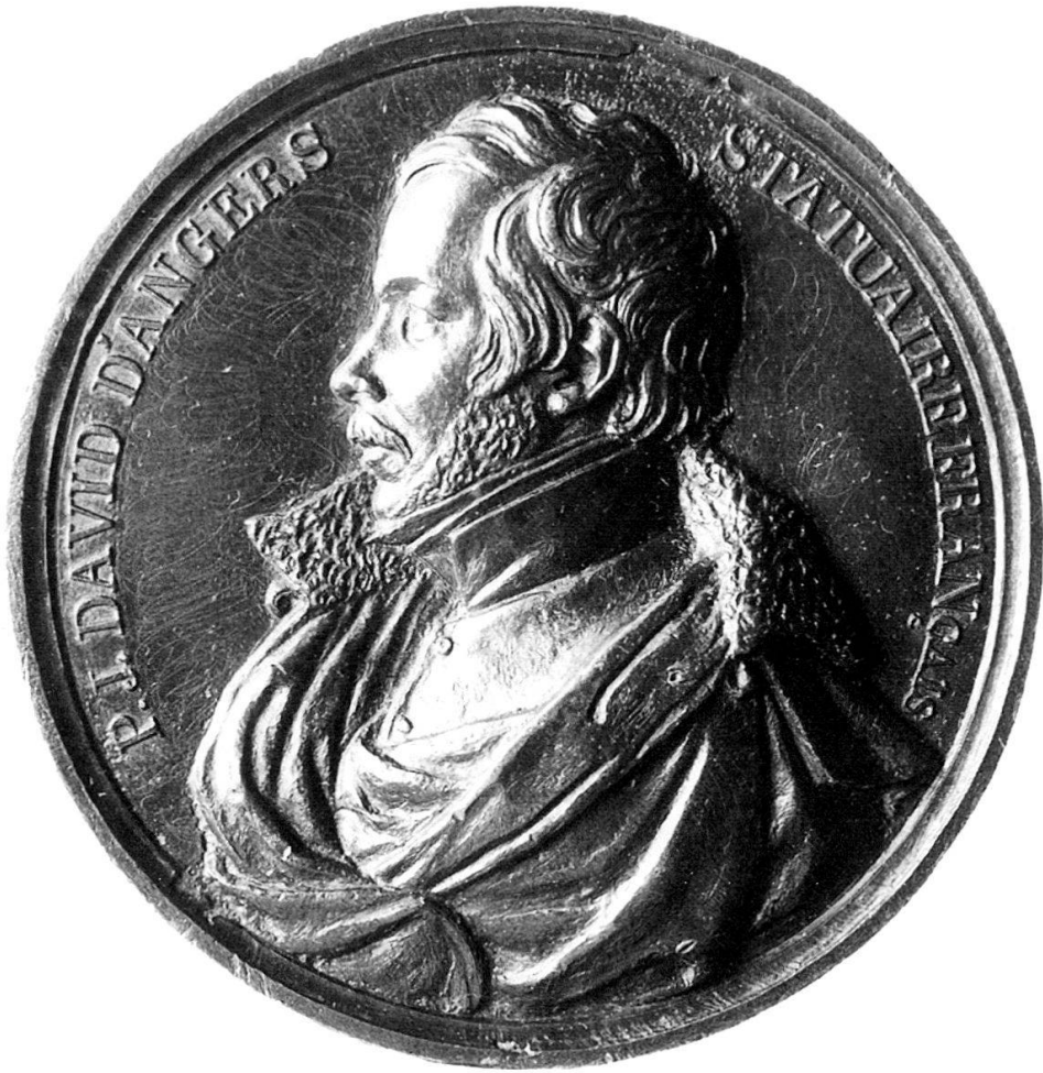
Abb. 8: HFB, David d'Angers, 1834 Guss, Blei, 98 mm