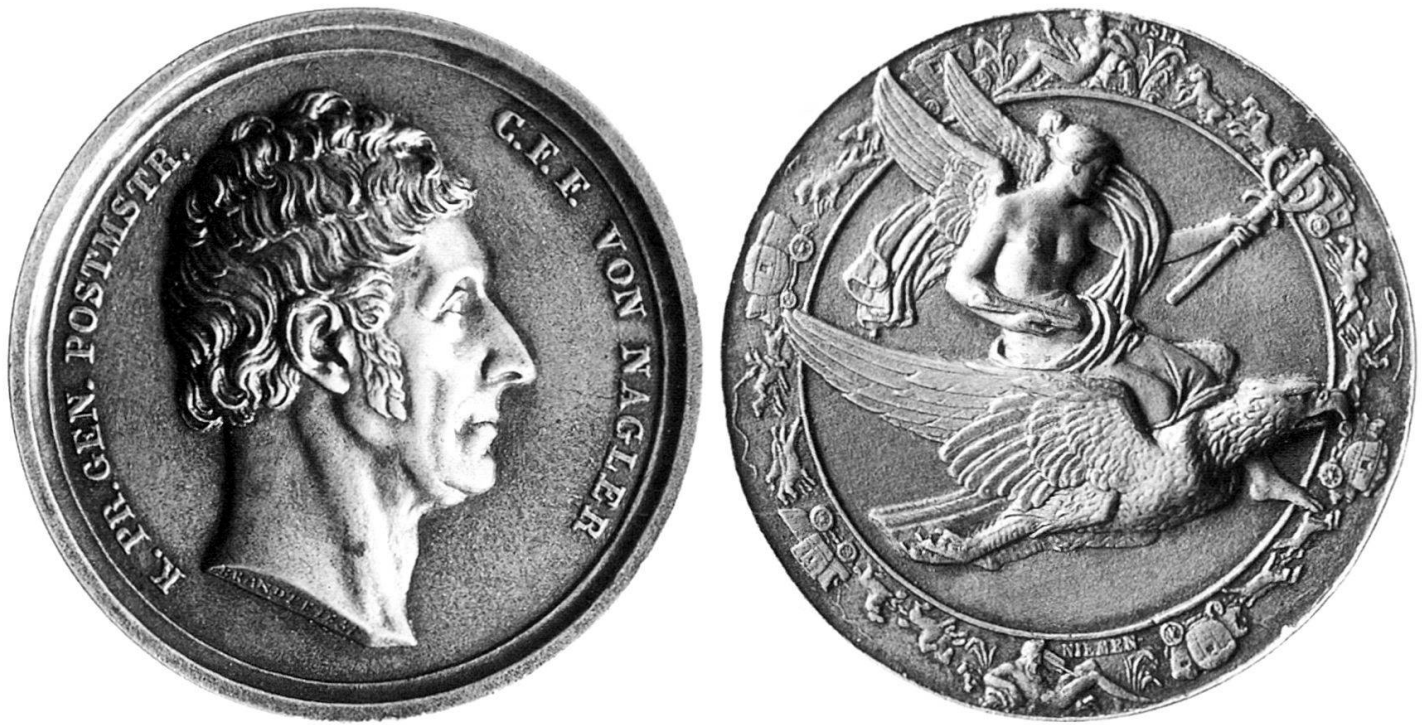
Abb. 10: HFB, Generalpostmeister von Nagler, 1837 Guss, Bronze versilbert, 78 mm