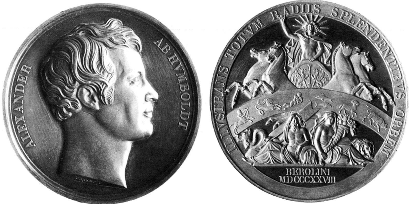
Abb. 5: HFB, Alexander von Humboldt, 1828 Prägung, Silber, 63 mm