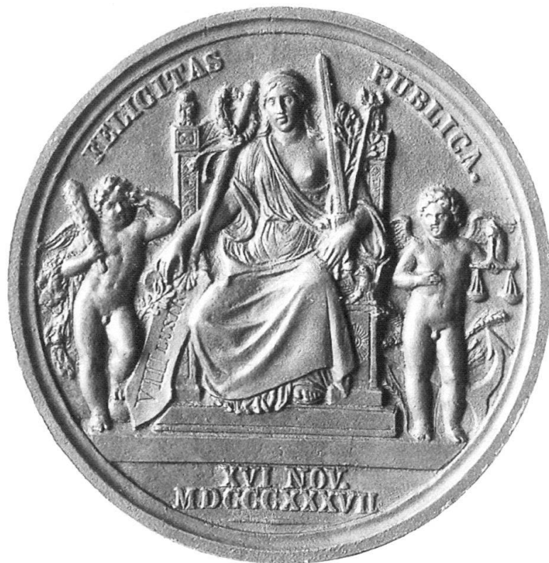
Abb. 12: HFB, König Friedrich Wilhelm III., 1837 Guss, Bronze, 78 mm