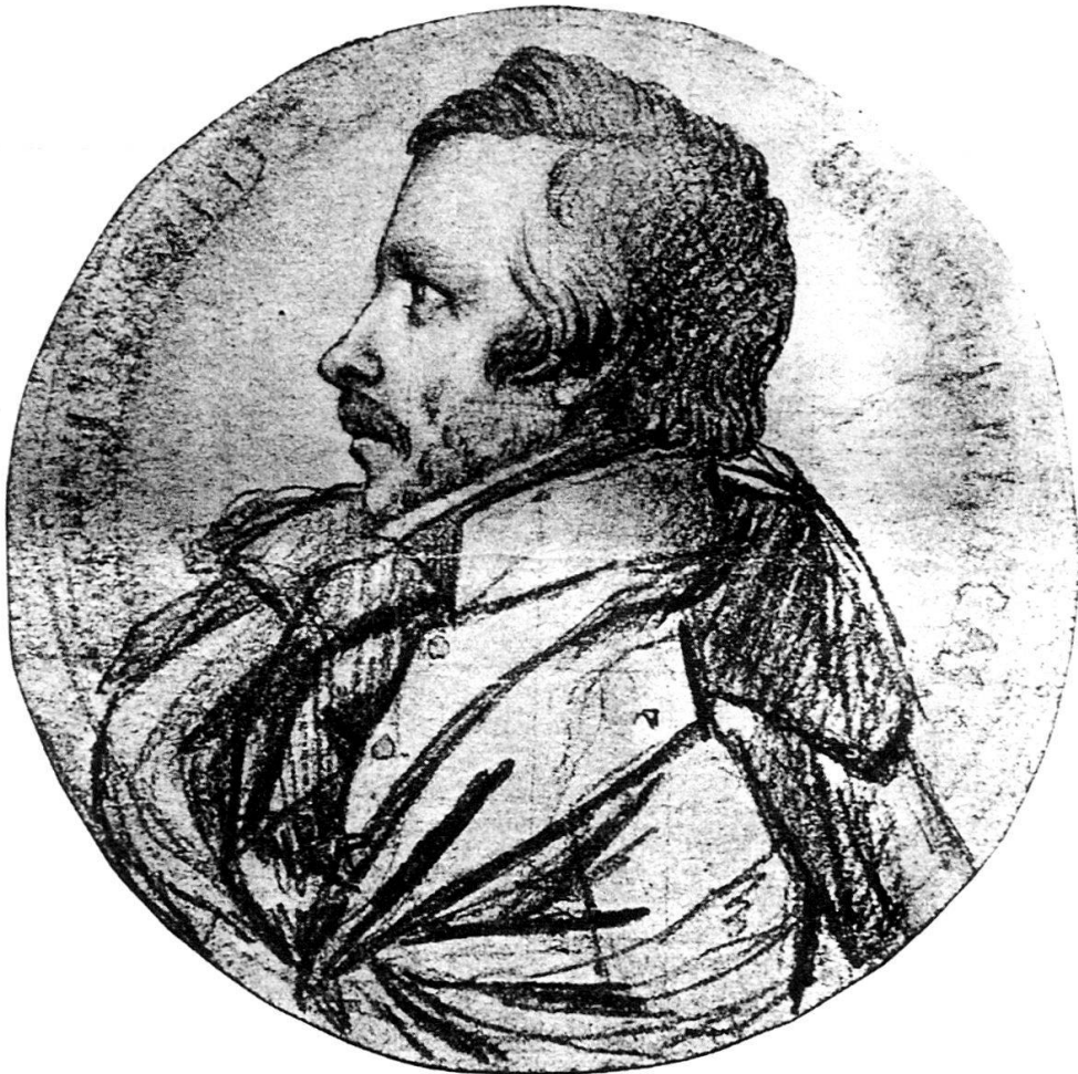
Abb. 9: Skizze zu Abb. 8 mit Korrekturen Davids