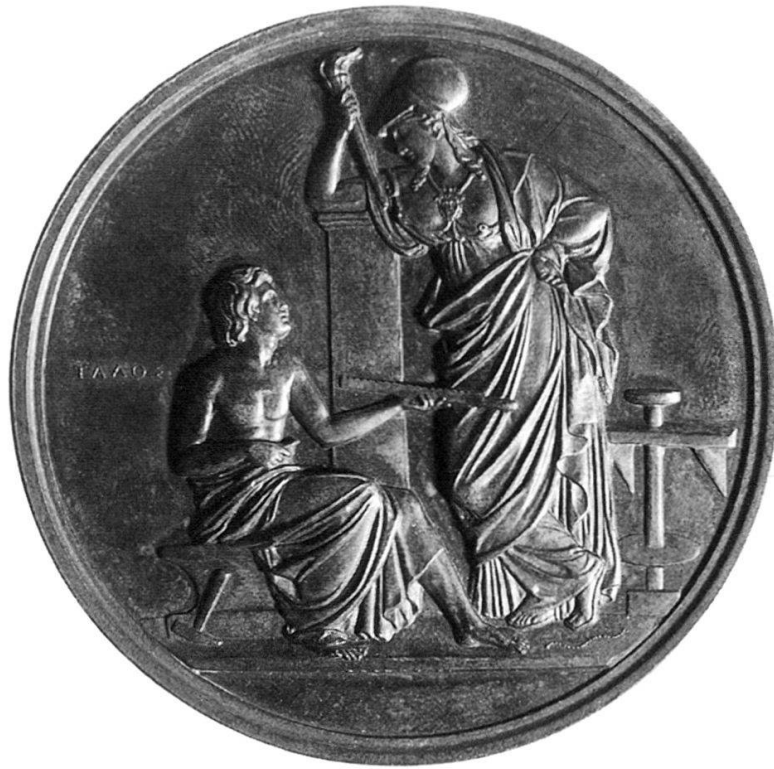
Abb. 4: HFB, Gewerbeleiss in Preussen (Vorderseite), o.J. (1823) Prägung, Silber, 78 mm