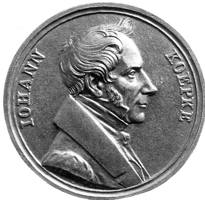
Abb. 16: HFB, Johann Koepke, o.J. (um 1835?) Guss, Bronze, 69 mm