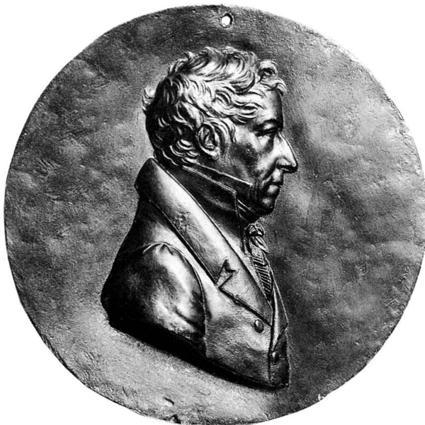
Abb. 1: Leonhard Posch, Selbstbildnis, 1815 Guss, Zinnmodell, 87 mm