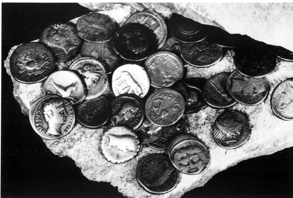
Le trésor de Dombresson NE, découvert en 1824.

du mardi au dimanche 10 à 12 h et 14 à 17 h, jeudi entrée gratuite.