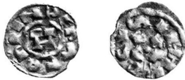
Abb. 1: Lucca, Denar (Typ K. B/C), 0,95 g. Univ.Slg. Tübingen (Efd. Raum Aléppo).

Weil Lucca eine der ursprünglich sechs, später vier königlichen Münzstätten in Italien war, trugen die Luccheser Denare des Hochmittelalters Namen und Titel der italienischen bzw. deutschen Könige und Kaiser. Dies führte dazu, dass seit dem Regierungsantritt Heinrichs III. (bzw. Heinrichs II. als italienischer König) im Jahre 1039 bis über den Tod von Heinrich V. (1125) hinaus, ausserdem zuvor schon unter Heinrich II. bzw. I. (1004–1024 König in Italien), stets der bereits immobilisierte Titel «+IHPERATOR» um ein Henricus-Monogramm im Perlkreis auf den Avers geprägt wurde, und auf dem Revers der Name «+ENRICVS» um den stilisiert angeordneten Stadtnamen «LV CA» zu lesen war. Daher muss erst noch der Versuch unternommen werden, die Masse der Luccheser Heinrichs-Denare oder «denari enriciani», wie sie in Italien heute genannt werden, aufgrund stilistischer Merkmale und der Machart zu differenzieren, zu klassifizieren und annäherungsweise zu datieren.