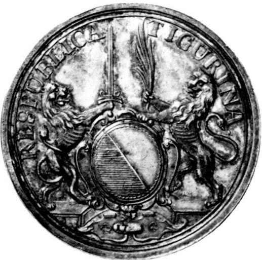
Abb. 1 c