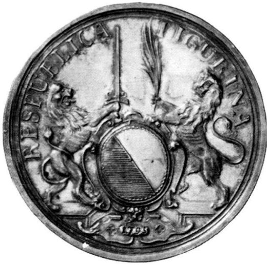
Abb. 1 a