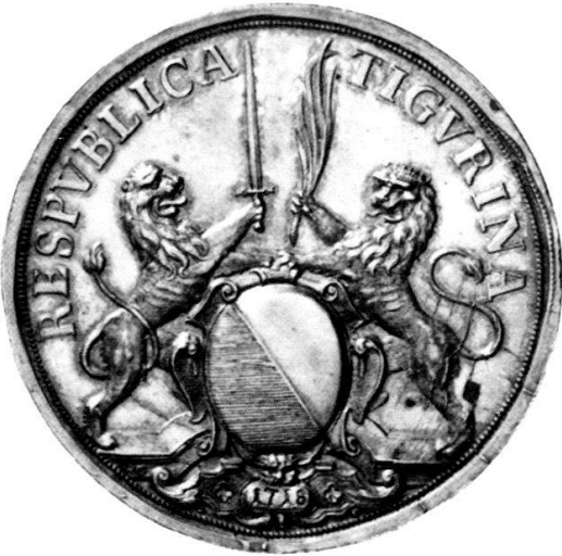
Abb. 1 b