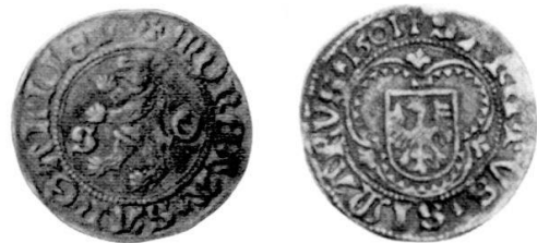
Abb. 2: Billon, 2,15 g, 90° (Zweites bekanntes Stück).

nung MONETA SANGALLIEN , welche auf dem Original immer getrennt als MONETA SANCTI GALLI geschrieben ist, und auf der Rückseite den Namen SANCTVS SIMARVS , einen völlig unbekanntes Heiligen. Auch die Zeichnung der einzelnen Details