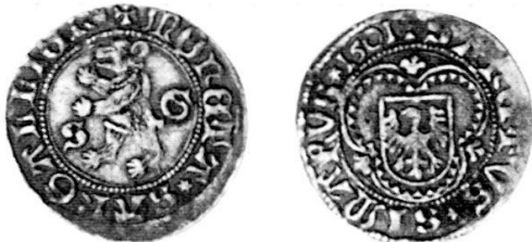
Abb. 1: Das Stück von Edwin Tobler; Billon, 1,95 g, 135°.

In der Zwischenzeit ist ein zweites Stück dieses SIMARVS-Plapparts zum Vorschein gekommen, welches der Unterzeichnende neben die oben erwähnte Münze legen und vergleichen konnte ( Abb. 2 ). Beide Stücke sind aus demselben Stempelpaar geprägt und scheinen von ähnlichem Metall zu sein, ja auch die stellenweise bräunliche Patina ist beiden gemeinsam, so dass der Verdacht aufkommt, dass der Fund- bzw. Herstellungsort, obwohl auch im Fall des zweiten Plapparts unbekannt, identisch sein könnte.