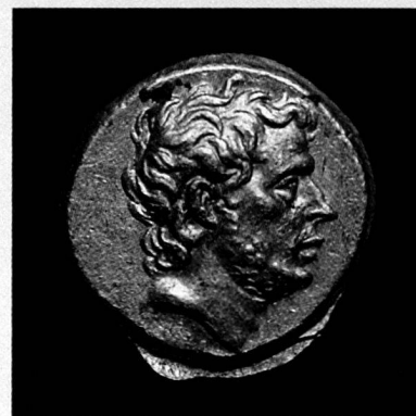
T. Quinctius Flamininus, statère d'or, Grèce, 196 avant JC