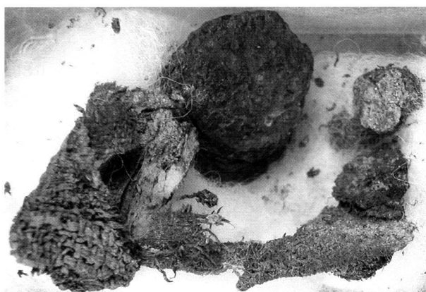
Figure 1: La bourse avant sa dissociation.

Les restes textiles concrétionnés sur les monnaies ont été analysés par Mme Antoinette Rast-Eicher, du Büro für archäologische Textilien, à Ennenda. Malgré le peu d'éléments conservés, il lui semble que la bourse était en lin (fig. 1). La dissociation du lot a permis de dégager 11 monnaies (fig. 2). Les deux pièces extrêmes n'ont toutefois pas pu être séparées de leur voisine immédiate à cause de leur grande fragilité. Les déterminations sont les suivantes (elles sont données dans l'ordre précis de la bourse):