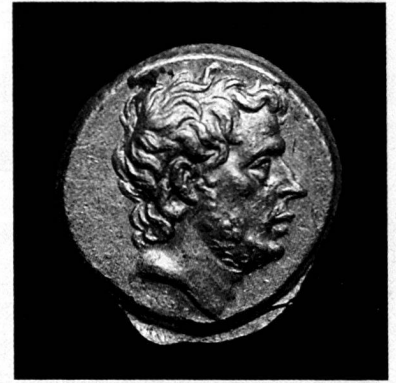
T. Quinctius Flamininus, statère d'or, Grèce, 196 avant JC