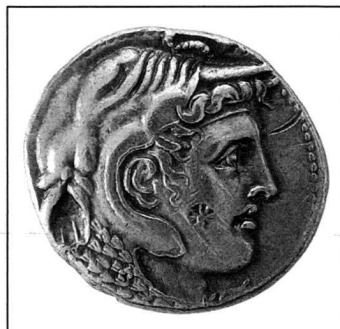
Ptolémée I er pour Alexandre le Grand, Egypte, 323–306 av. J.-C., tétradrachme, argent.

SALLE DE LECTURE mardi à jeudi 09h00–12h00 14h00–17h00 lundi, vendredi et samedi fermé