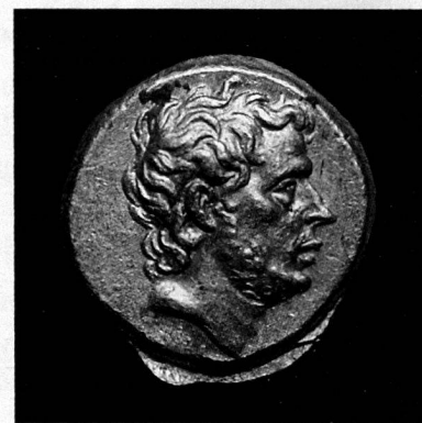
T. Quinctius Flamininus, statera d'or, Grèce, 196 avant JC