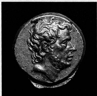
T. Quinctius Flamininus, statère d'or, Grèce, 196 avant JC