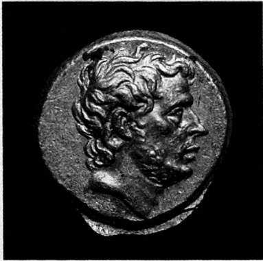
T. Quinctius Flamininus, statère d'or, Grèce, 196 avant JC