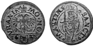
Abb. 6: Schilling von Uri 1623.