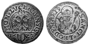
Abb. 5: Schilling von Luzern 1623.