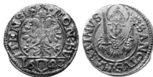
Abb. 7: Schilling von Schwyz 1623.