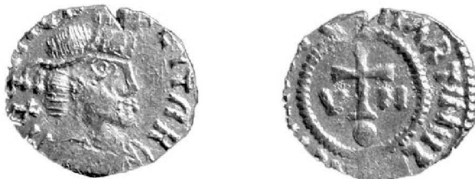
Abb. 2 (Mst. 3:1).