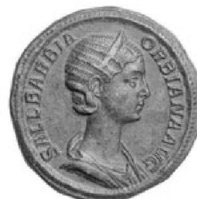
Sallustia Barbina Orbiana, sestercie de bronze

TRADART GENEVE SA 1, rue du Perron - 1204 Genève Tel +41 22 817 37 47 - Fax +41 22 817 37 48 e-mail : numismatique@tradart.ch site : www.tradart.ch