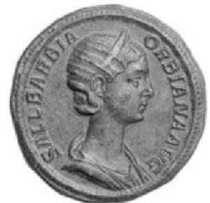
Sallustia Barbia Orbiana, sestertio de bronze

TRADART GENEVE SA 1, rue du Perron - 1204 Genève Tel +41 22 817 37 47 - Fax +41 22 817 37 48 e-mail : numismatique@tradart.ch site : www.tradart.ch