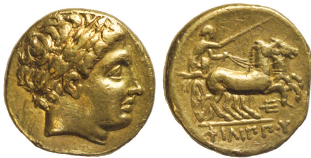
Fig. 2: Statère posthume de Philippe II de Macédoine, 323–317 av. J.-C. (échelle 2:1).

une première exposition permanente portant le nom évocateur de « Collections monétaires » est réalisée en 1997. En 2015, elle est entièrement actualisée et devient « Par ici la monnaie! », un parcours ludique qui mêle Histoire et Économie.