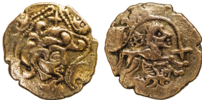
Fig. 3: Statère des Osismes, 80–50 av. J.-C. (échelle 2:1).

Nous concluons en rappelant que l'exposition n'est pas seulement là pour raconter l'histoire des Celtes et leur rapport à la mon-