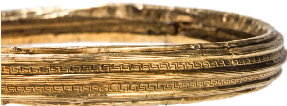
Fig. 1: Torque en or de la tombe de Payerne (Suisse, Vaud), VI e siècle av. J.-C.

Après plusieurs expositions hors les murs,