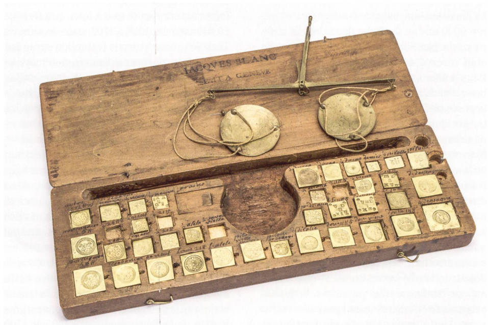
Fig. 4: Boîte monétaire en bois contenant trébuchet et dénéraux en laiton, dernier quart du XVII e siècle.