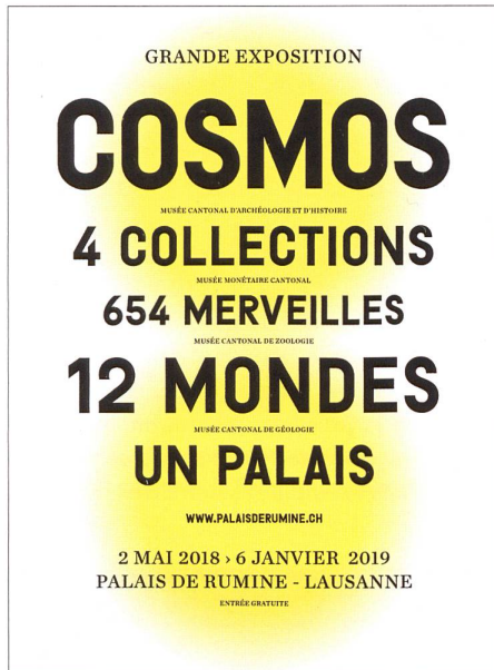
Fig. 1: Affiche de l'exposition COSMOS

Les Musées cantonaux d'archéologie et d'histoire, de géologie, de zoologie et le Musée monétaire cantonal ont le plaisir de vous présenter COSMOS, une exposition qui fait vibrer le Palais de Rumine à Lausanne, du 2 mai 2018 au 6 janvier 2019.