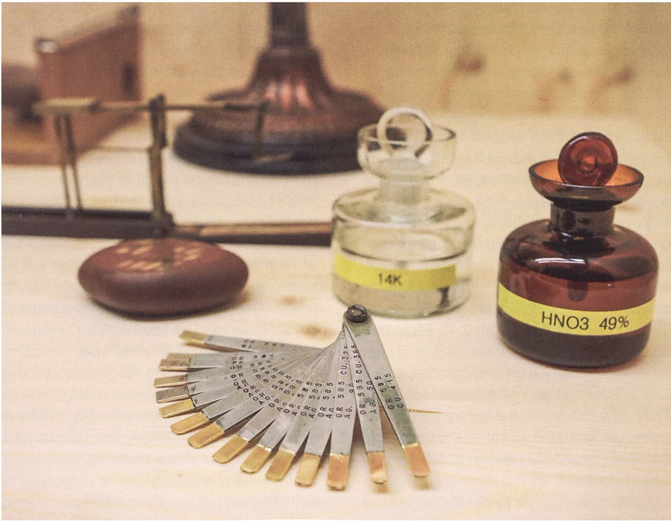
Fig. 3: Jeu de touchaux en étoile, pierre de touche en radiolarite et fioles avec dilutions d'acides, XX e -XXI e siècle (prêt du Contrôle fédéral des métaux précieux, Genève).

lement utilisés pour l'essai des métaux précieux, portent aussi d'autres noms comme les jaspes noirs, les lydiennes et les phtanites. La novaculite, une roche sédimentaire constituée de quartz microcristallin extraite des Monts Ouachita dans l'Arkansas (USA) et dont la couleur varie du blanc au noir, est également utilisée comme pierre de touche en raison de sa dureté, de sa densité et de son grain très fin.