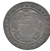
Av. 15 / Rv. 6