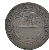
Av. 19 / Rv. 19