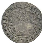
Av. 17 / Rv. 14