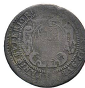
Av. 16 / Rv. 14