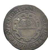
Av. 20 / Rv. 16