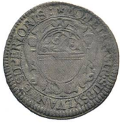
Av. 9 / Rv. 9