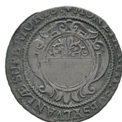
Av. 3 / Rv. 3