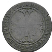
Av. 4 / Rv. 4