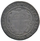
Av. 14 / Rv. 13