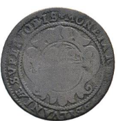
Av. 2 / Rv. 17