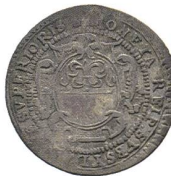
Av. 16 / Rv. 6