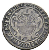
Av. 2 / Rv. 18