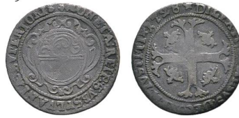
Av. 8 / Rv. 20

Es versteht sich von selbst, dass die Obwaldner Halbbatzen mit Jahreszahl 1726 weitaus am häufigsten vorkommen müssen, was auch der Fall ist. Es ist für Spezi­alsammler von Obwaldner Münzen bereits die Ausnahme, einen Halbbatzen 1727 zu entdecken, und noch seltener findet er ein Exemplar mit der Jahreszahl 1728.