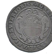
Av. 12 / Rv. 10