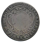
Av. 13 / Rv. 11