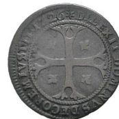
Av. 4 / Rv. 5