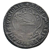
Av. 10 / Rv. 9