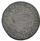
Av. 9 / Rv. 3