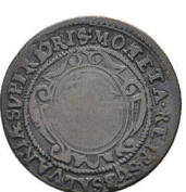
Av. 18 / Rv. 15