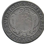
Av. 12 / Rv. 4