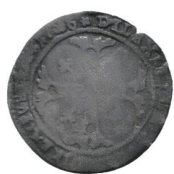
Av. 6 / Rv.