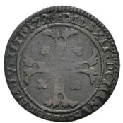
Av. 6 / Rv. 8