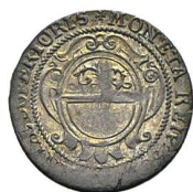
Av. 1 / Rv. 1