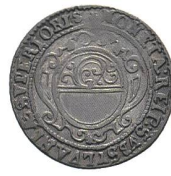
Av. 8 / Rv. 11