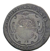
Av. 14 / Rv. 12