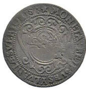
Av. 11 / Rv. 9