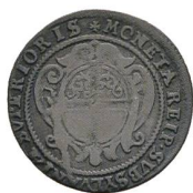
Av. 5 / Rv. 6