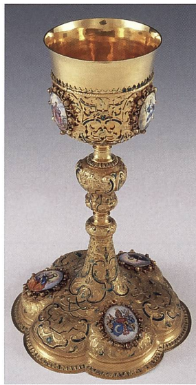
Abb. 4: Der für das Jubiläum 1723 hergestellte Rheinauer Kelch (Höhe 27 cm), der sich im Historischen Museum Basel befindet (Inventarnummer 1890.51)

Die Ausgaben für die Jubiläumsfeierlichkeiten im Jahr 1723 lassen sich in drei Gruppen zusammenfassen: Gastbetrieb, liturgische Anschaffungen sowie Ehrengaben (Münzen, Honorare und Ehrenbecher). Die Gesamtsumme beläuft sich auf 4376 Gulden. Davon entfallen etwas mehr als ein Drittel (rund 1600 Gulden) auf die Münzprägungen 23 . Für Abt Gerold verlängerte sich indes das Jubiläum durch Münzvergaben bis ins Jahr 1734, wobei er nochmals rund 1000 Gulden für Prägungen ausgab 24 . Damit kamen ihn diese Ehrengaben fast auf die Hälfte der Gesamtausgaben zu stehen. Die Repräsentation, die sich dank der Ehrengaben in der Zeit verlängern liess, bedeutete dem Barockfürsten ganz offensichtlich viel und sie war dauerhafter als die feierlichen Liturgien und die Gastmähler. Zu dieser äusseren Repräsentation gesellte nach innen der kostbare Kelch und die prunkvolle Mitra 25 .