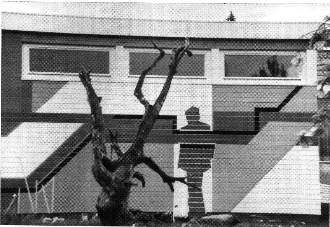
Hausbemalung 1970 (Haus Sulzer, Riehen). «Kunst am Bau» aus der «Klasse Fedier» in Basel, 1970.

aber in besonderem Masse, weil es nur zwei Fachlehrer gibt und diese selbst freie Künstler sind. Glücklicherweise ist dieser «freie Künstler als Lehrer» noch von den Meistern der alten Akademien übriggeblieben.