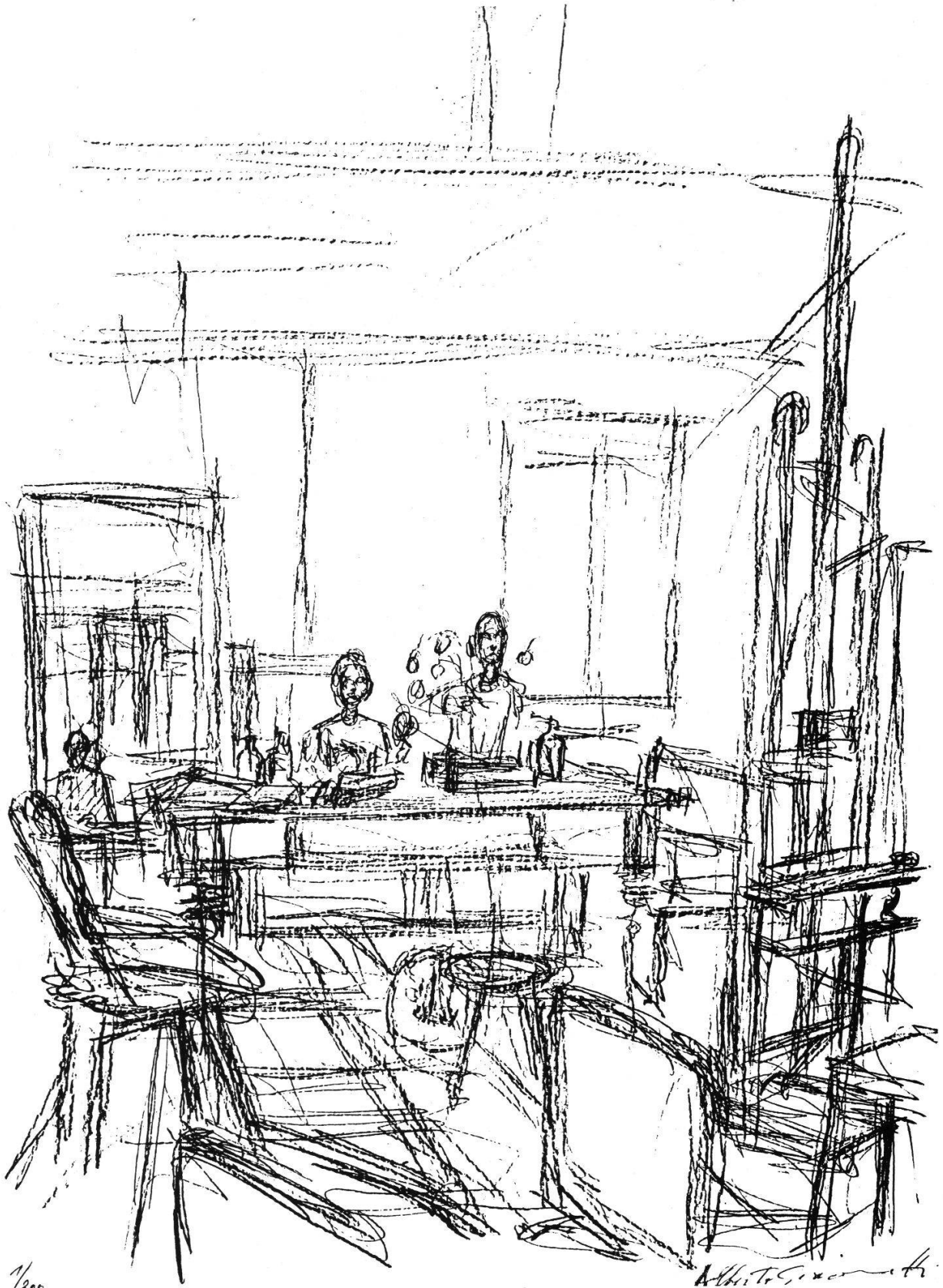
ATELIER, 1965 LITHOGRAPHIE VON ALBERTO GIACOMETTI (1901-1966)