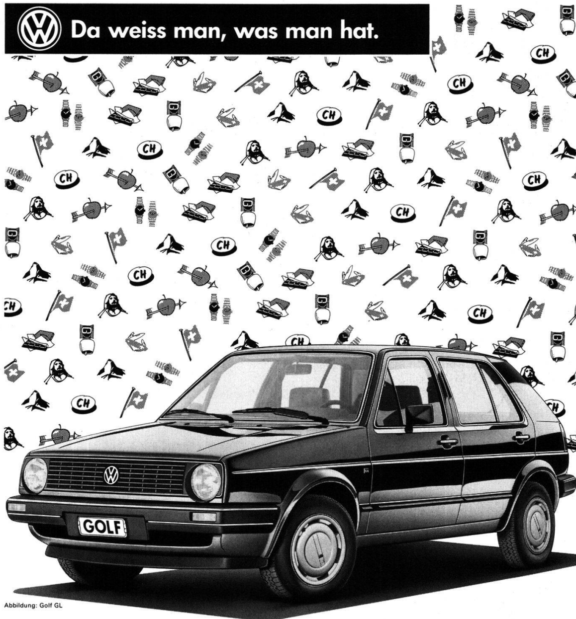
Abbildung: Golf GL