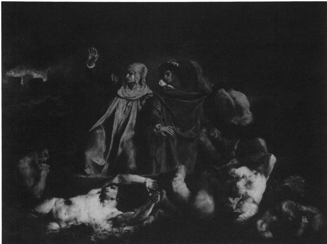
Abbildung 1: Eugène Delacroix, La Barque de Dante , 1822. Öl auf Leinwand, 189 × 241,5 cm. Musée du Louvre.

absichtlich sündiger Tat. Die Dramatik des Achten Gesanges — der literarische Stoffe der Dantearke — ist ungeheuer; erst der Neunte bringt die Lösung. Dante und Vergil geraten als Individuen in eine existenzielle Krise. Vergils Hoffnungen sinken, sein Schützling verliert den Mut weiterzugehen. Es gilt, einen Kampf zu bestehen, aber beiden fehlen die Kräfte.