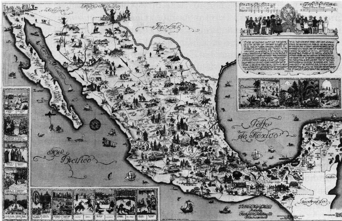
Pictorial Map of Mexico. Published by Fischgrund Publishing Co. Das von Traven an Chatto and Windus geschickte Original ist verloren. Das abgebildete Exemplar befindet sich in der kartographischen Sammlung der Harvard-Universität.