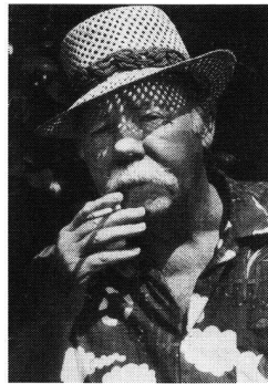
Charles Willeford 1919-1988