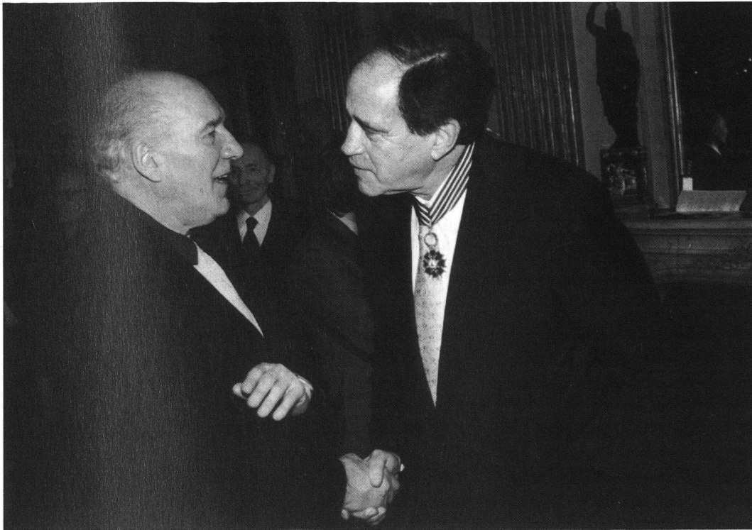
Der französische Schauspieler Michel Piccoli gratuliert Arthur Cohn, der Anfang 1995 mit dem höchsten Orden Frankreichs «Commandant des Arts et des Lettres» ausgezeichnet wurde.

aber, Filme zu zeigen, die in Inhalt und Qualität für eine gute Mund-zu-Mund-Propaganda sorgen. Denn das Herausbringen eines Filmes wird immer teurer, in den USA startet man oft Filme in mehr als 2000 Sälen, und wenn das schiefgeht, kostet es enorm viel Geld.