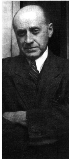
Starb vor 40 Jahren am 7. Juli 1956, Gottfried Benn, im April 1947

Dieser in der Kunst aufleuchtende Welt-horizont scheint durch die Wirklichkeit auf der Weltbühne eher karikiert; da beherrschen gescheiterte Umweltkonferenzen die Szene oder Weltwirtschaftsgipfel, deren Entscheidungen der Mehrheit der Weltbevölkerung wie zynische Planspiele vorkommen. Ähnliches gilt für die geistliche Variante des Kosmopolitismus: Ein weltreisender Papst sucht mit glaubens-touristischen Mitteln den allumfassenden Anspruch, den seine Kirche im Titel führt, auf zeitgemässe Art, wenn auch mit reaktionären Inhalten, aufrechtzuhalten. Will sagen: Ob seitens der Politik oder der Kirche – zunehmend wird der Universalismus mehr inszeniert, denn inhaltlich gestaltet.