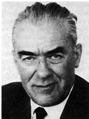
Walter Muschg, 1898–1965