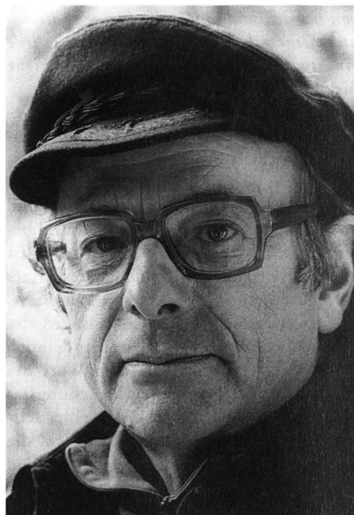
Walter Vogt (1927–1988)

Authentizität, an, und die ist eben, wie mir schon lange bewusst ist, nur auf Gebieten zu haben, die man wirklich kennt, in denen man lebt – und in was lebt man mehr als in der eigenen Haut.»