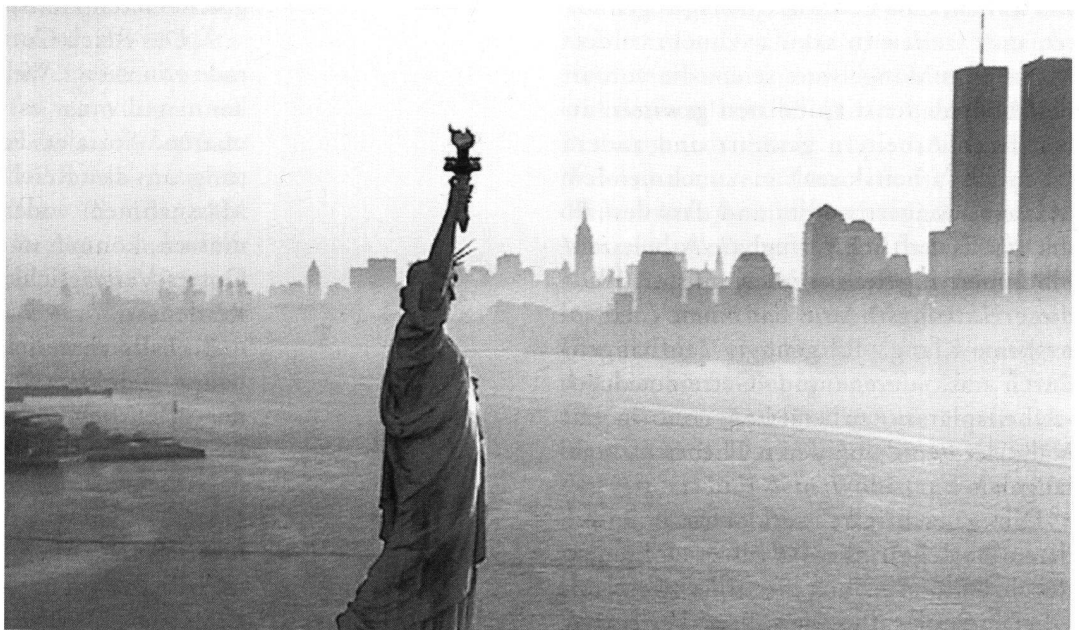
Freiheit – zentraler Leitwert der Moderne, aus: Hans Küng, Spurensuche. Die Weltreligionen auf dem Weg . Piper München 1999.

Ob die Wirtschaft wächst, wie sie quantitativ und qualitativ wächst, ist dem kollektiven Wollen entzogen.