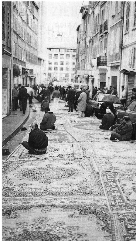
Islam in Frankreich. Teppiche zum Freitagsgebet in Marseille, aus: Hans Küng, Spurensuche. Die Weltreligionen auf dem Weg. Piper München 1999.

Bedarf es grosser weltpolitischer Einschnitte im positiven wie im negativen Sinne, um der Forderung nach allgemein verbindlichen ethischen Grundsätzen Nachdruck zu verleihen. Es fällt auf, dass das Projekt «Weltethos» publizistisch nach 1989 entstand und offensichtlich aufgrund der seither eingetre-