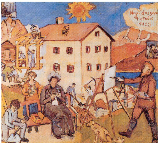
Alberto Giacometti, Silberne Hochzeit, 1925, Öl auf Leinwand, 65 x 73 cm, Privatbesitz

Dieses Bild wurde von meinem Bruder Alberto zum Tage der silbernen Hochzeit meiner Eltern gemalt: Noza d'Argent, 4. Oktober 1925. Auf dem Bild versammelte Alberto die ganze Familie. Mein Vater malt – wahrscheinlich malte er gerade ein Bild von meiner Mutter –, also der Kunstmaler und sein Modell. Meine Mutter strickt, neben ihr steht meine Schwester Otilia. Alberto hat sich selbst als Steinhauer gemalt.