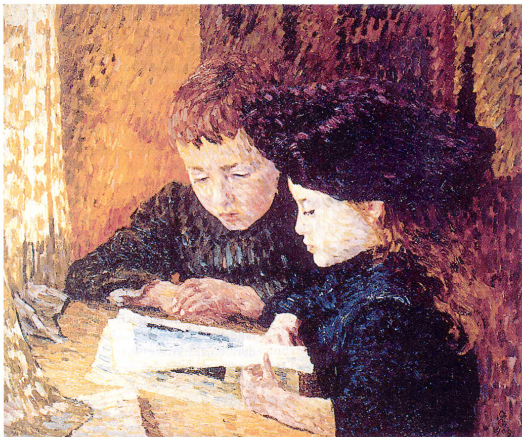
Giovanni Giacometti. Diego e Ottilia (Il libro di immagini), 1909. Olio su tela, 55 cm x 65 cm. Firmato e datato in basso a destra: GG 1909. Collezione privata. (Aus dem Katalog)