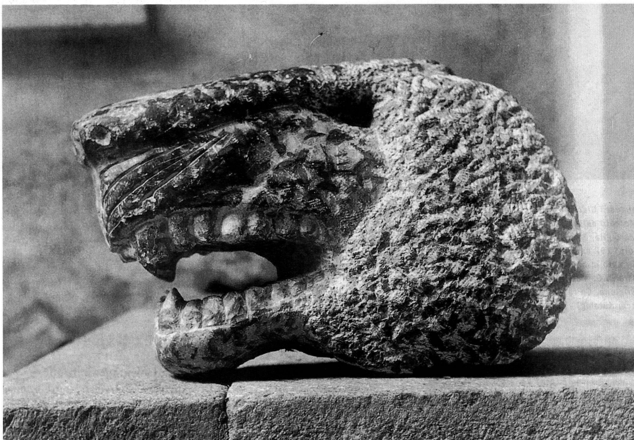
Diego Giacometti. Testa di leone, 1935–36. Serpentino della Val di Poschiavo, 32 x 45 x 20 cm. Colle- zione privata. (Aus dem Katalog)