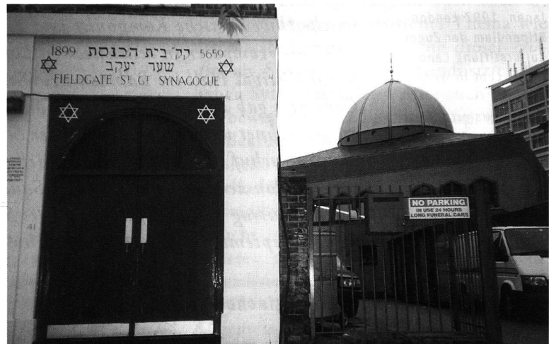
Die grosse «East London»-Moschee an der Whitechapel Street, an die auf der Hinterseite übergangslos die Fieldgate Street-Synagoge anschliesst, ist an eine Citroën-Garage angebaut, so dass die Stimme des Muezzins vom Minarett über der smogroten Sonne und der rotweissen Doppelraute erschallt.

teile Ostpakistan und Westpakistan. Der Name «Pakistan» entstand übrigens aus der realpolitischen Retorte: P für Punjab, a für Afghan, ki für Kaschmir, s für Sind und tan für Belutschistan. 1971 erklärte sich der östliche Teil als Republik Bangladesh unabhängig. Ein grosser Teil der Flüchtlinge ging nach Indien, ein kleinerer nach London: Das sind allerdings immer noch einige Zehntausend.