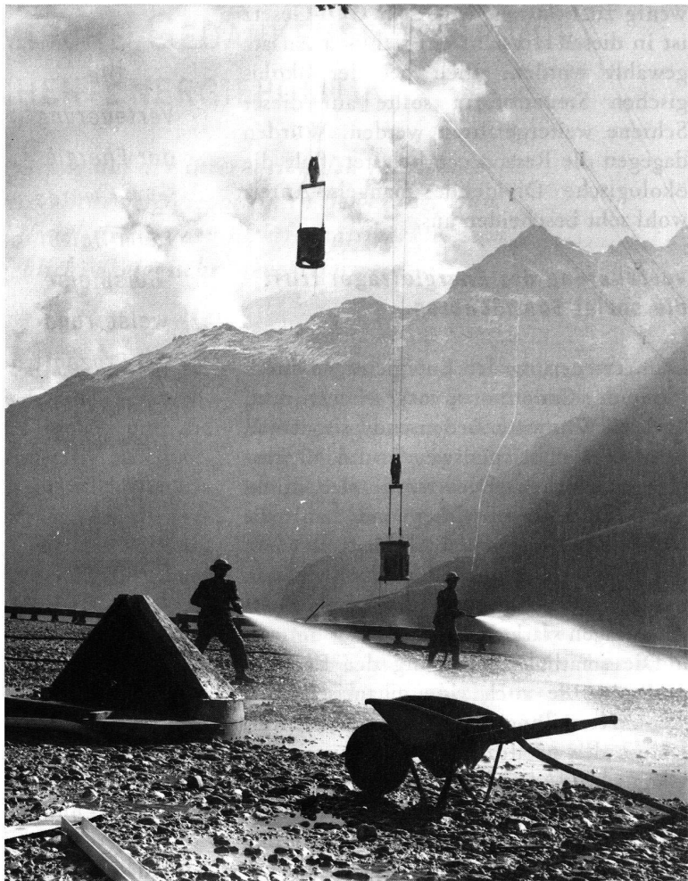
Betonierungsarbeiten an der Blava (Betonzentrale für die ganze Baustelle).

Mit der Annahme der Solarinitiative oder der Förderabgabe wurde eine energiepolitische Weiche falsch gestellt. Der Einsatz erneuerbarer Energien ist zu begrüssen, doch sollen sich diese in der Anwendung auf dem Markt selbst durchsetzen, nachdem deren Erforschung durch den Staat gefördert worden ist. Die Wasserkraft hat die vorgesehenen Staatskrücken nicht nötig. Sollte sich die Überbrückung eines Engpasses bei der Amortisation einzelner neuerer Werke im Zuge der Strommarkt-