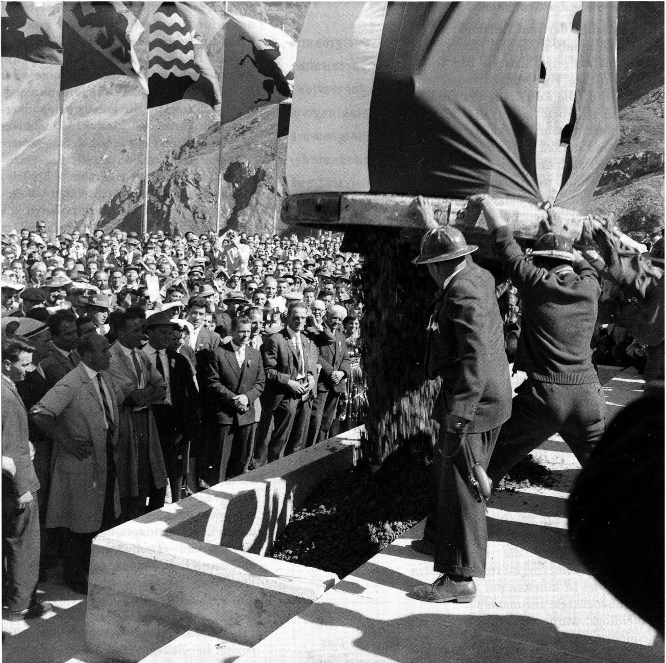
Bau der Grande Dixence. Feier aus Anlass der Leerung des letzten riesigen Betonkübels am 22. September 1961.

niemand die Gewinne von Unternehmungen oder das Arbeiten abschaffen wollen. Auch dieses Argument verkennt also die neue Zielausrichtung des ökologischen Steuersystems: es geht um einen ersten behutsamen Schritt in Richtung aufkommensneutrale Umstrukturierung innerhalb des Steuersystems.