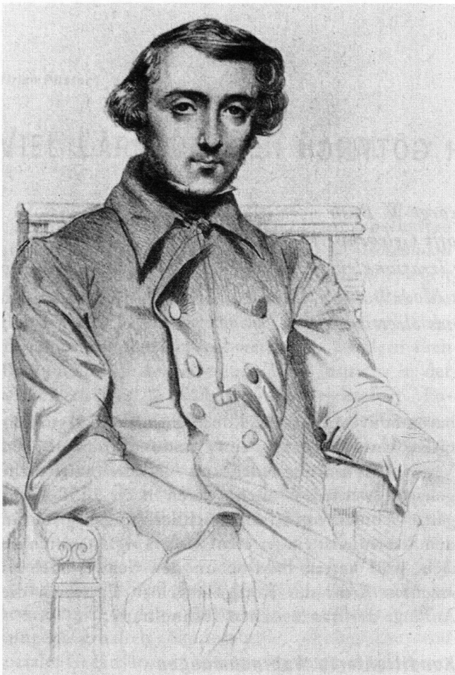
Alexis Comte de Tocqueville, nach einer Lithographie von Chasse-riau

schof, von dort aus weiter an die Pfarreien: « Escoutez doncques, loiaux François... ». Gottgewolltes wurde hier gezielt gepredigt und flächendeckend unters Volk gebracht: die unantastbare Einheit der Nation, die alles umfassende Verantwortung der Krone sowie die ewigen Prinzipien von autorité und obéissance . Ein eminent staatsdienlicher Diskurs – und die Methode sollte Schule machen. Noch im 20. Jahrhundert hat die Ecole laïque als zentralstaatlich kontrollierte, militante Geistlichkeit des republikanischen Kults jene Funktionen ausgeübt, welche der Klerus für das Ancien Régime übernommen hatte.