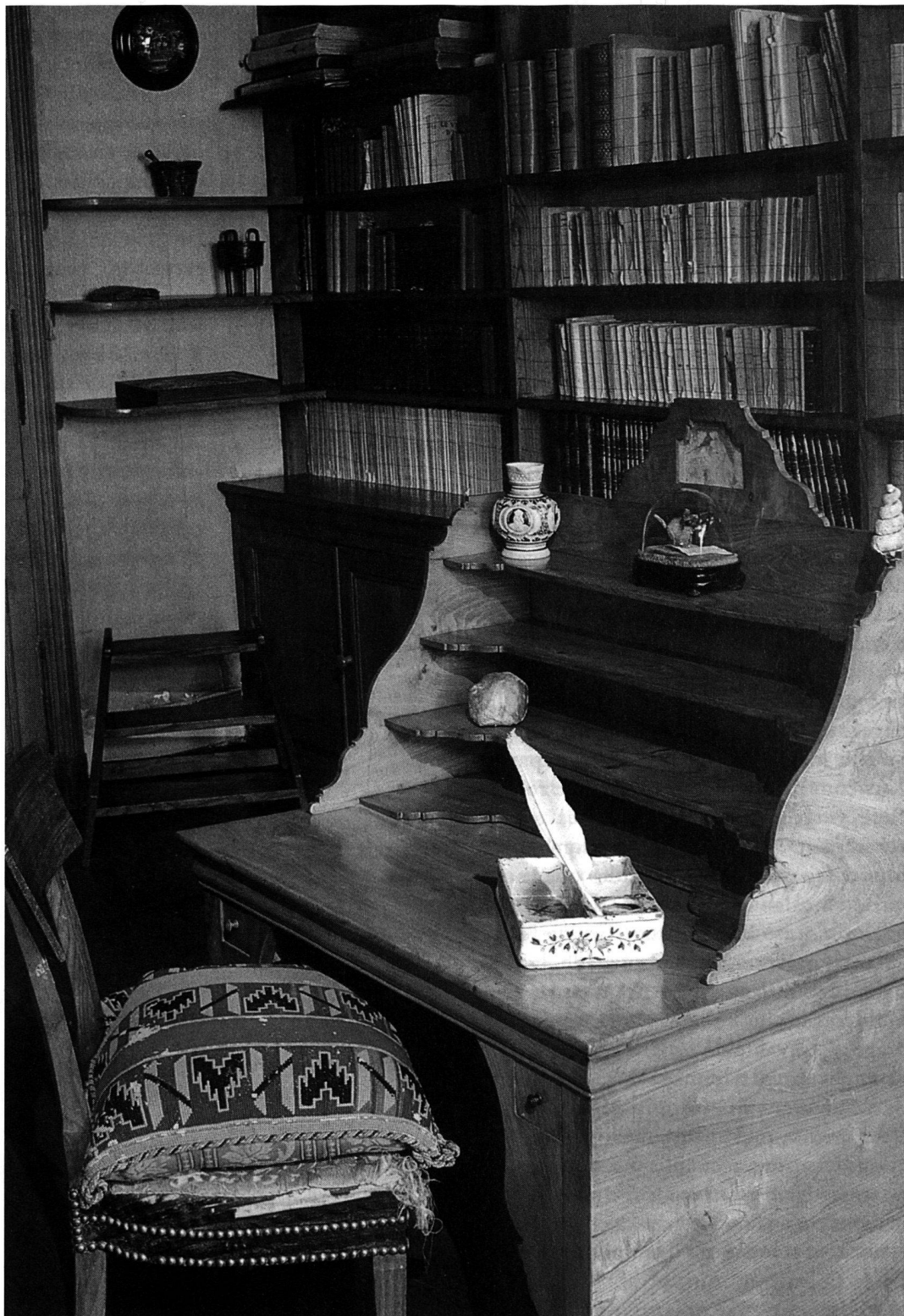
Chopins Schreibtisch in George Sands Schloss Nohant.

extrême, du temps exécrationnel, de la mauvaise nourriture, de l'hostilité des habitants. Chopin en revint plus mort que vif. Il n'en avait pas moins travaillé, notamment à ses «Préludes». Et les lettres de George à ses amis restés en France prouvent la profondeur et la générosité de son attachement à Frédéric, même s'il est probable que dès cette époque, les sentiments de la mère prirent le pas sur ceux