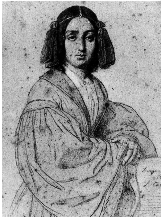
George Sand. Zeichnung von Luigi Calamatta, 1837.

Est-ce que la romancière a influencé l'œuvre de Chopin? Au premier abord, il semble bien difficile de répondre par l'affirmative. Lorsqu'on ignore la date de leur rencontre, il est impossible de déceler, entre les compositions antérieures et postérieures à 1838, une rupture stylistique, un changement d'esprit ou d'atmosphère, ou l'apparition de pièces d'un genre nouveau: il existe des mazurkas, des valse, des nocturnes et même des préludes antérieurs à 1838. Tout au plus peut-on signaler, au titre d'influence directe de George Sand, ou plutôt de Nohant, que Chopin se plut à reprendre au piano des mélodies populaires du Berry, s'intéressant à certaines de-