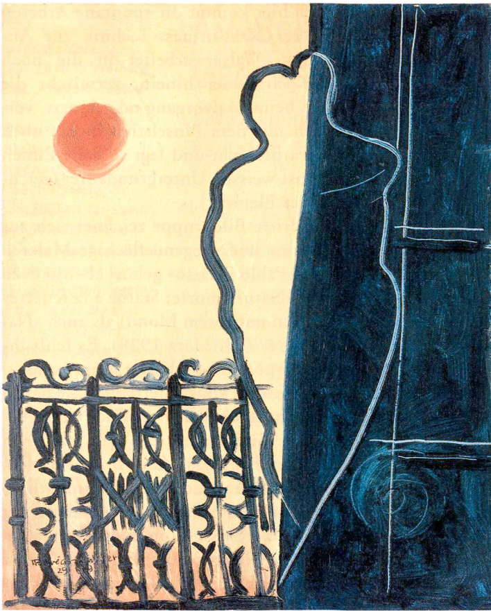
Enlacement (Balcon), 29.1.1929, Öl auf Karton, 46 x 37,8 cm, Privatbesitz.