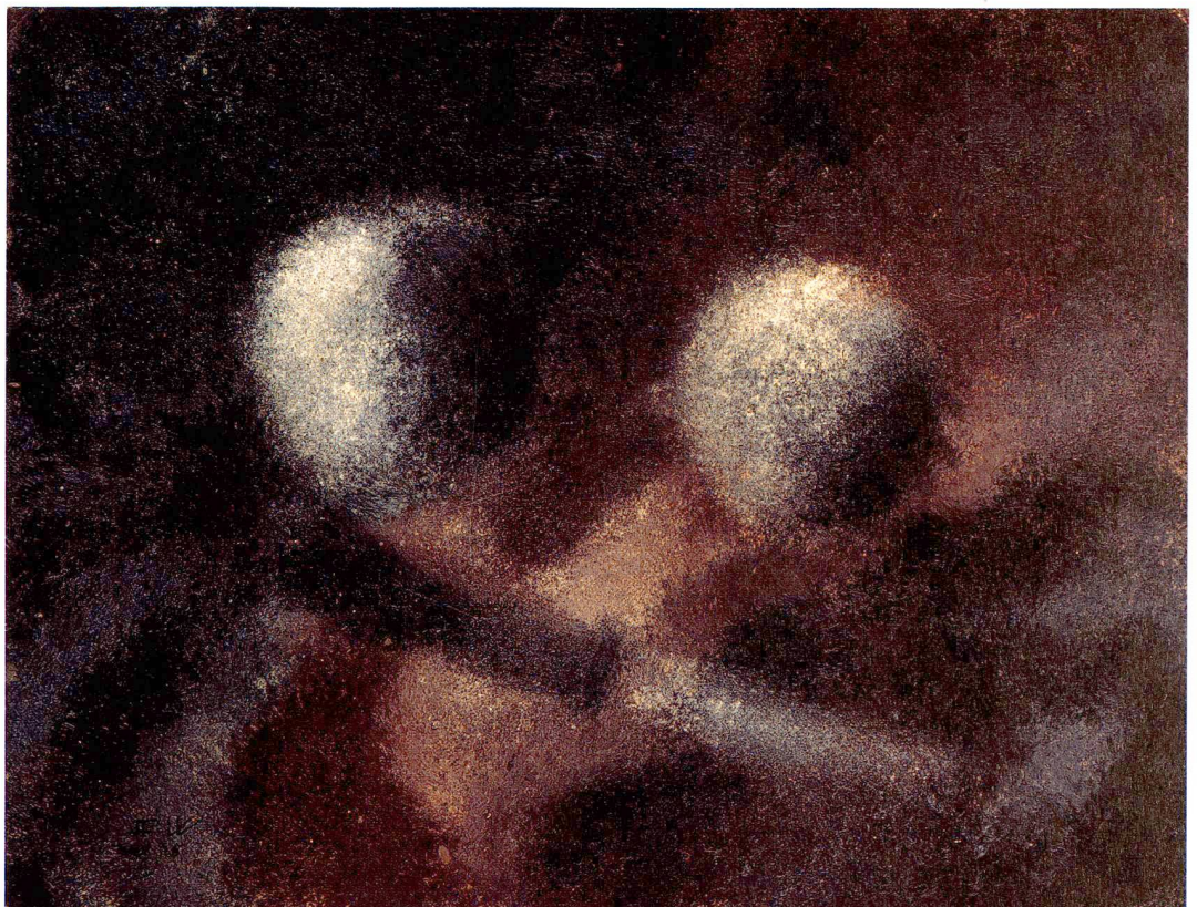
Ohne Titel (Nature morte) , 1928, Öl auf Karton, 27 x 34,8 cm, Privatbesitz.