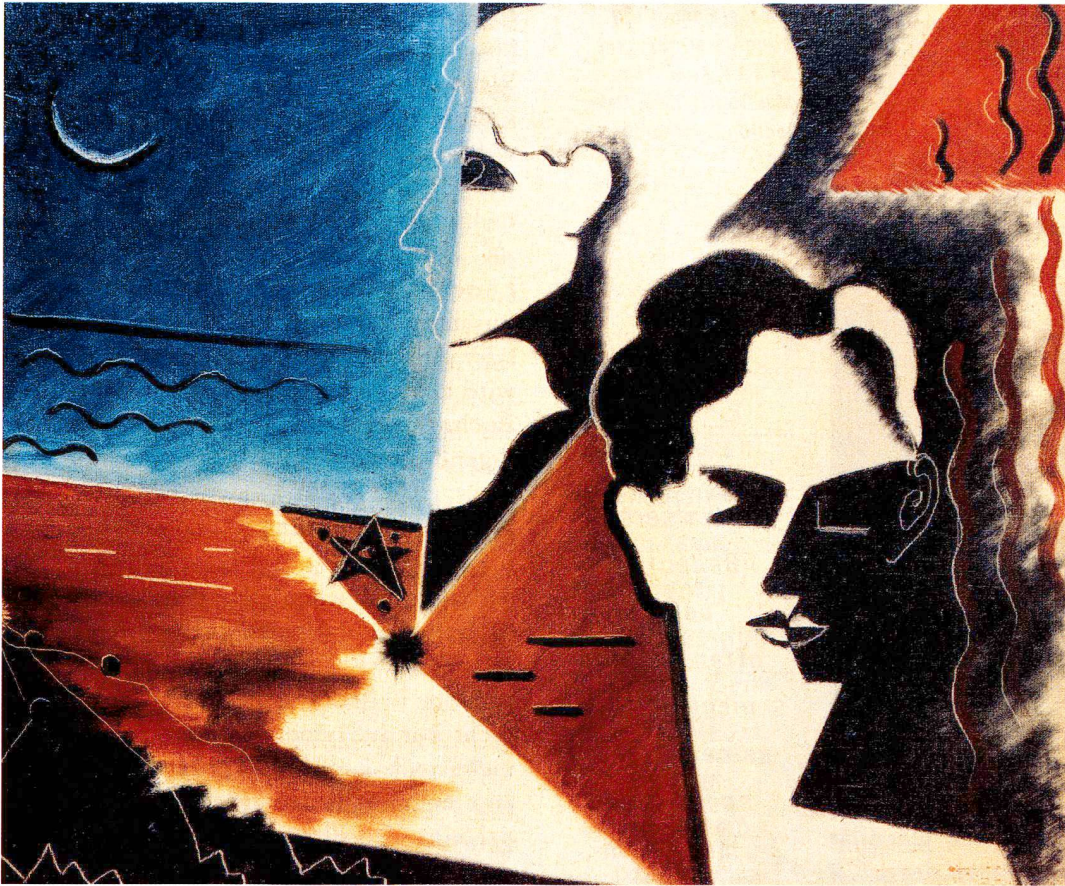
Le matin , 1929, Öl auf Leinwand, 54 x 61 cm, Privatbesitz.