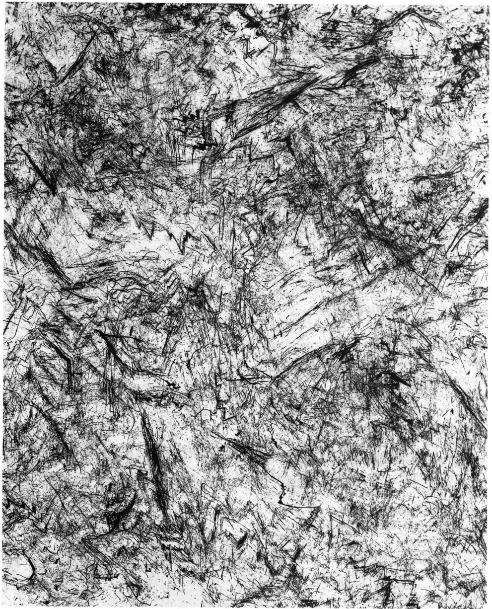
Beatrix Sitter-Liver, Ohne Titel (Idiome), Urtica, 1995, Tusche, 150 x 120 cm.