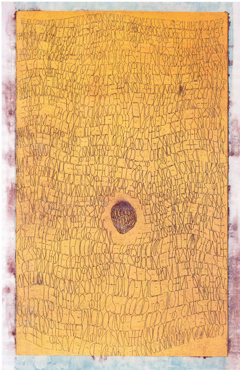
Stele delle ciliege 2, Xylografie polychrom, Unikat, 2002, 230 x 150 cm, © C. Berger