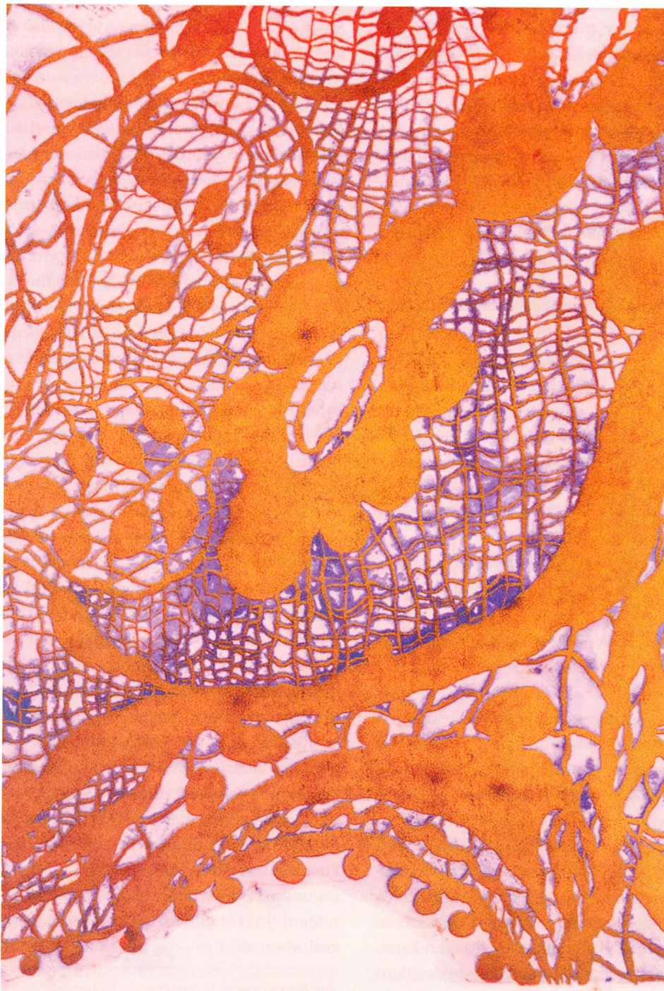
Felix Dikta, Linoldruck polychrom, 2002, 115 x 172 cm (Ausschnitt)