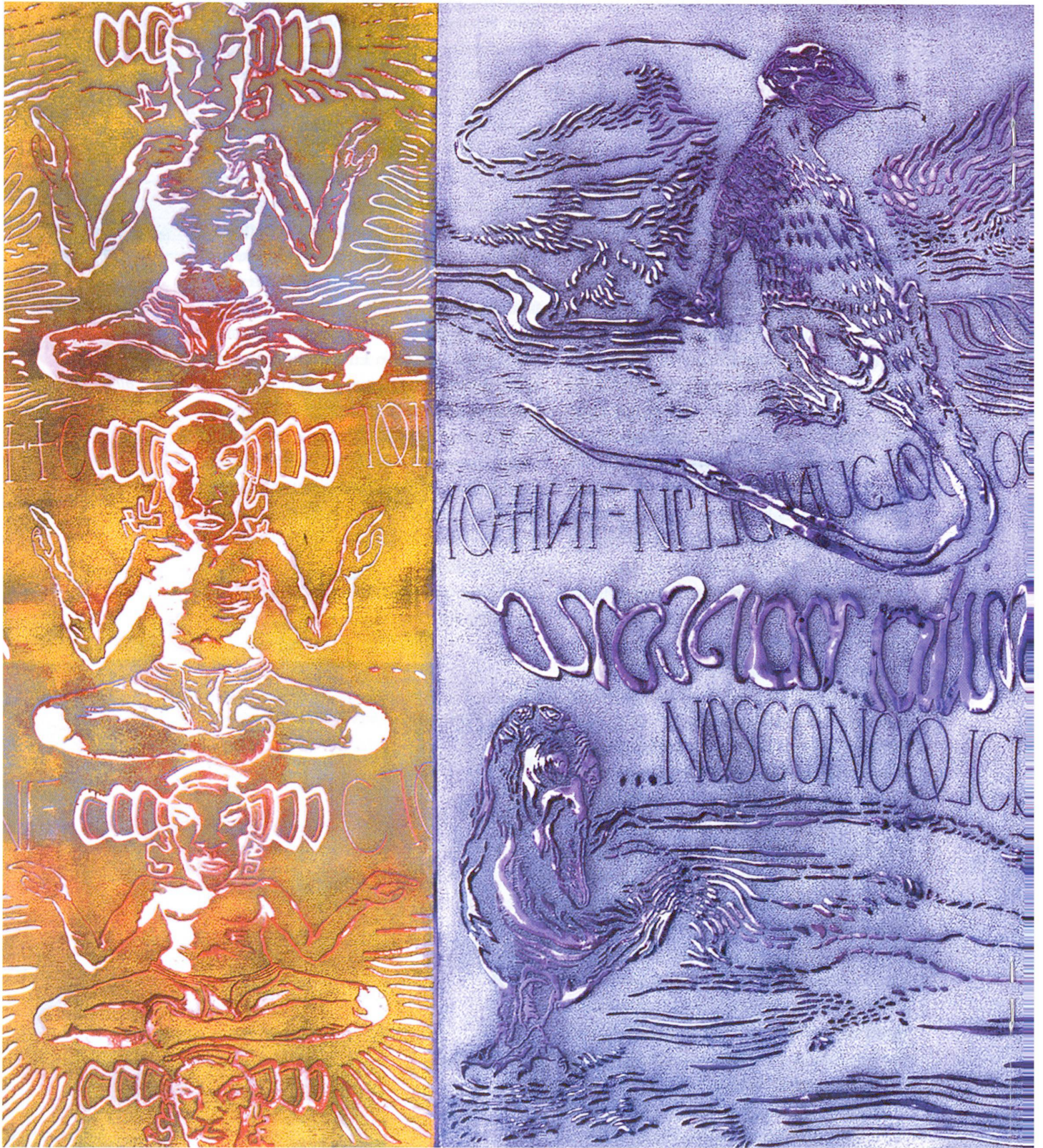
Da dove veniamo, «Alcuni nascono all'infinita notte» (W.B.), Einzelbild aus Triptychon, Xylographie polychrom, 2002, 154 x 230 cm