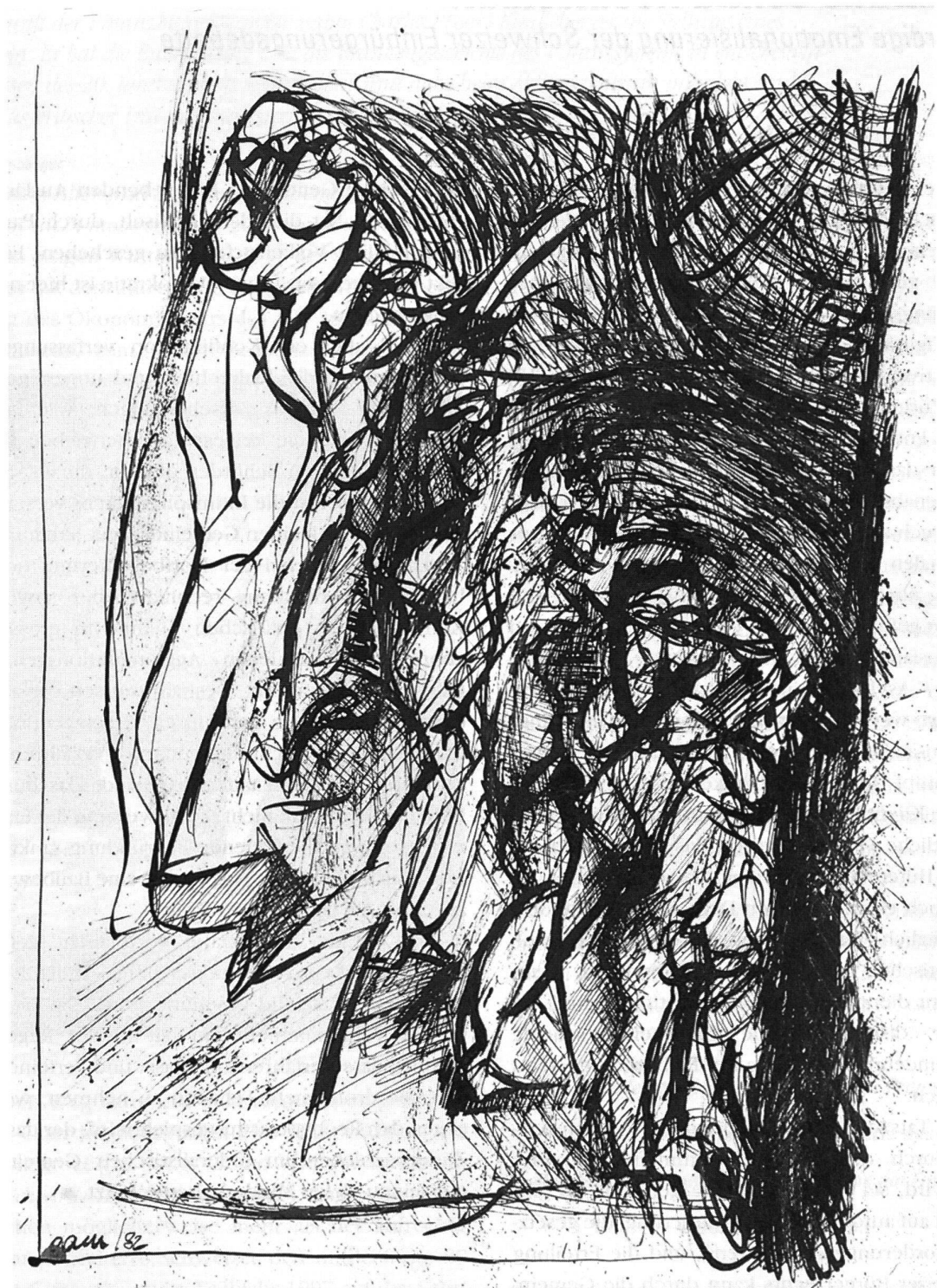
D'après Piranesi (Nudo che scende le scale), Tusche auf Papier, 1982, 42 x 30 cm