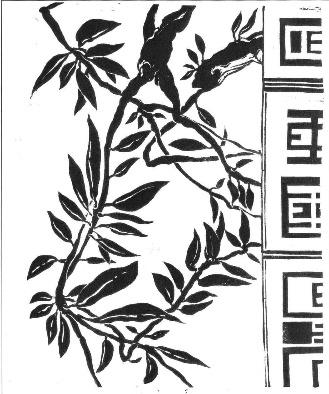
Rivelazioni celesti, Linoldruck, Studie für Zyklus 2003/2004