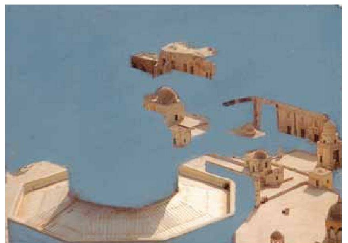
Aus dem Werkzyklus «Begraute», Wachskreide auf Ansichtskarte, 1999-2003, je 10,5 x 15 cm