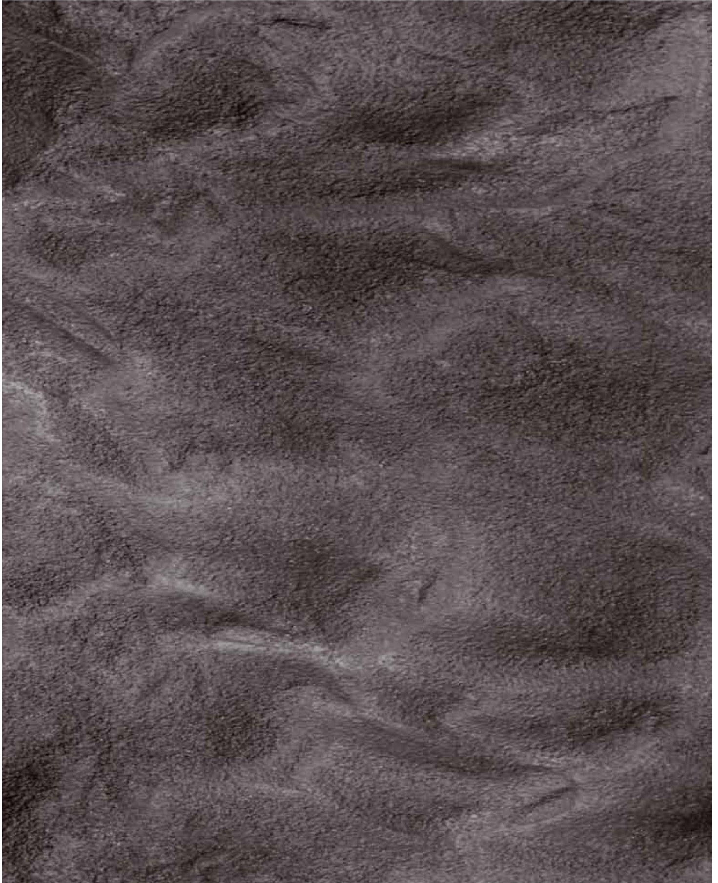
«Erosion I», Teilansicht, Bodeninstallation, 2000-2006, Photographie auf Barytpapier, 18-teilig, je 150cm x 140cm