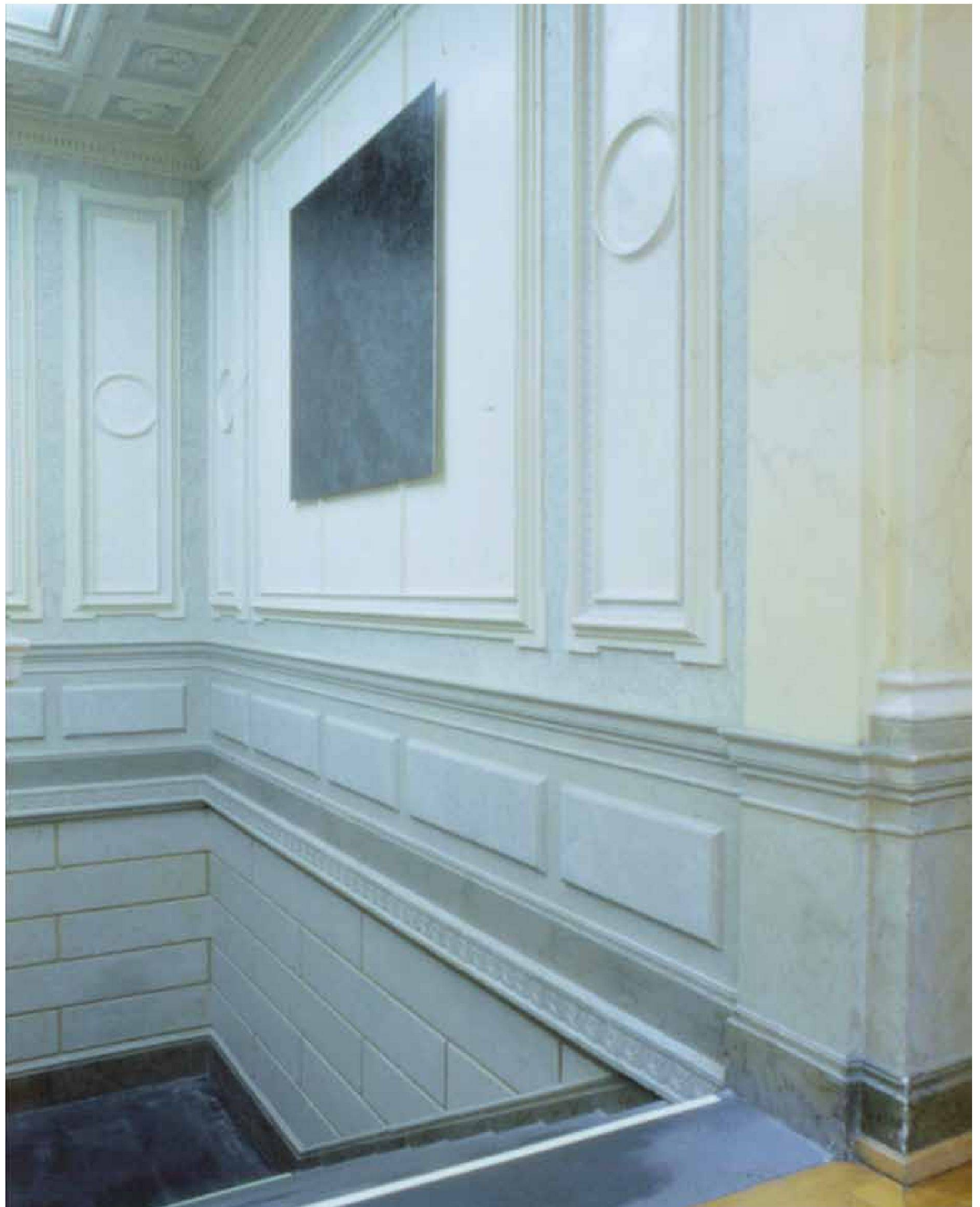
«Frozen Embryo», 2000, Photographie auf Barytpapier, 3-teilig, je 141cm x 150cm, Sammlung Bündner Kunstmuseum, Chur