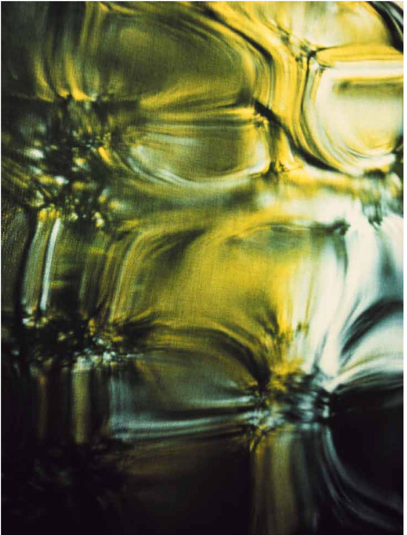
«03-F-7», LightJet-Fachprint auf Aluminium, 70 x 105 cm, Zürich 2003