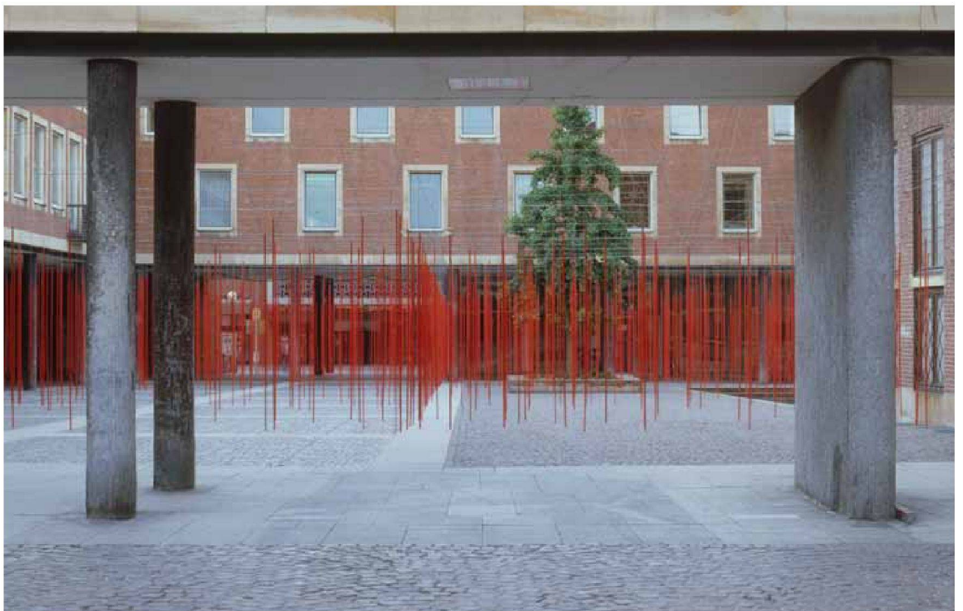
«Parcours», Installation, Münster 1996