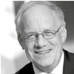
Johann N. Schneider-Ammann

Jetzt anmelden! www.europa-forum-luzern.ch