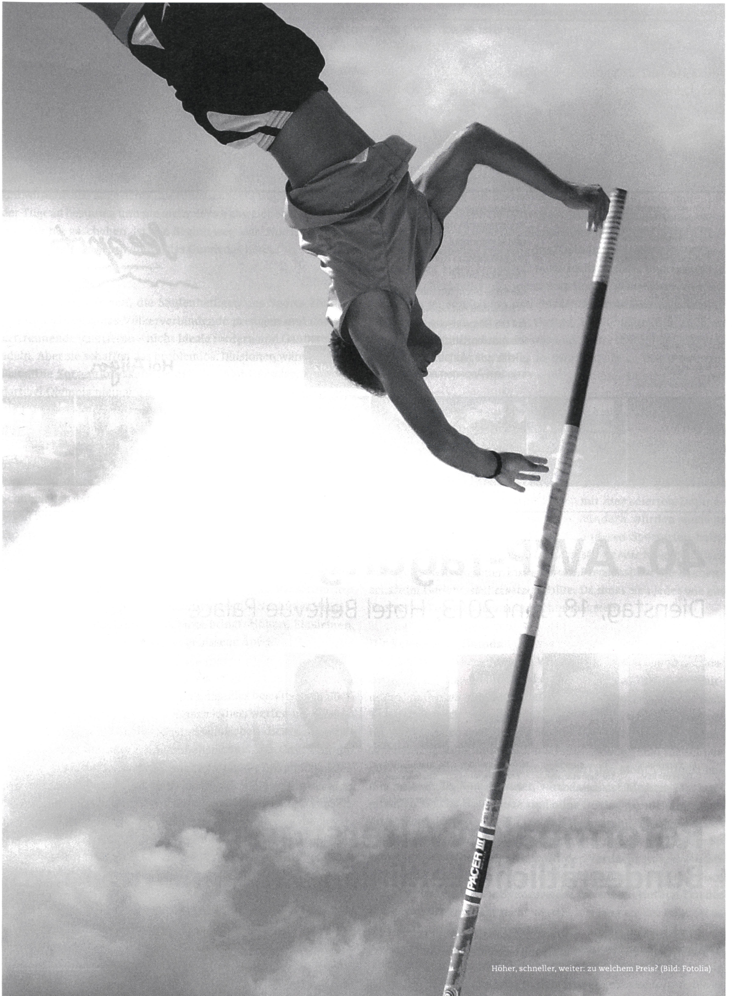
Höher, schneller, weiter: zu welchem Preis?