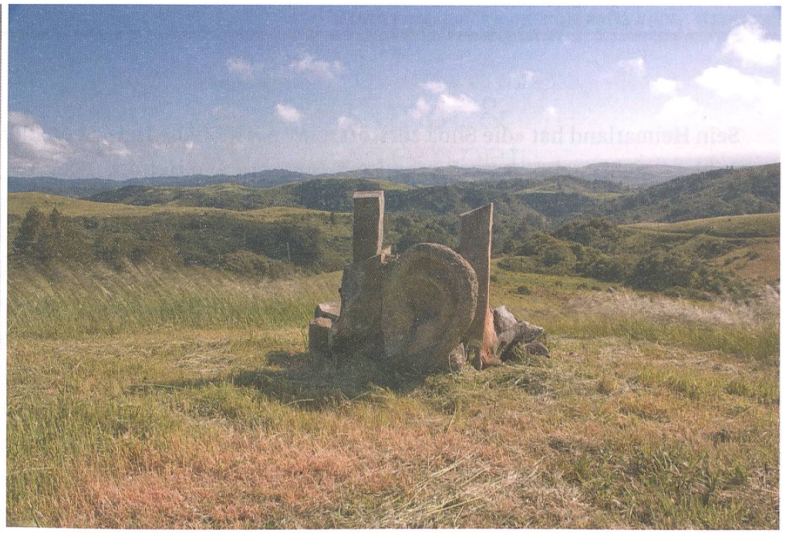
Oben: Brian Rust: «Listening Chair» (1996) / Bild: Anthony Lindsey. Links: Roland Mayer: «Dialog» (2004) / Bild: GoodEye Photography. Unten: Djerassis Kunstkolonie, fotografiert von Paul Dyer / CCS Architecture.