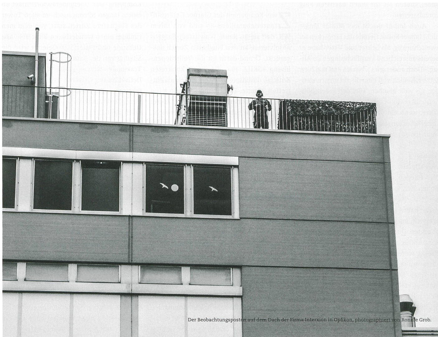
Der Beobachtungsposten auf dem Dach der Firma Interxion in Opfikon, fotografiert von Ronné Grob.

prinzip ist ihm anzumerken, er erkundigt sich sogleich bei mehreren der jungen WK-Soldaten, was sie im Berufsleben machten. «Klar, gibt es auch bei uns Probleme mit modernen Zivilisationserscheinungen wie Kiffen zum Beispiel», gibt Kellerhals zu, «ich meine aber, unsere Milizarmee ist heute sehr viel besser und auch motivierter als vor zwanzig Jahren.» Der riesige Vorteil der Milizarmee sei eben, so Kellerhals, dass sie aus hervorragenden Berufsleuten bestehe, die nicht nur ausführten, sondern auch mitdachten. «Wann immer ich Militärangehörige anderer Länder empfangen, sind die von uns sehr beeindruckt.» Dass viele sehr gut ausgebildete junge Leute den Zivildienst wählen und sich nicht in der Armee oder im Zivilschutz engagieren, bedauert er aller-