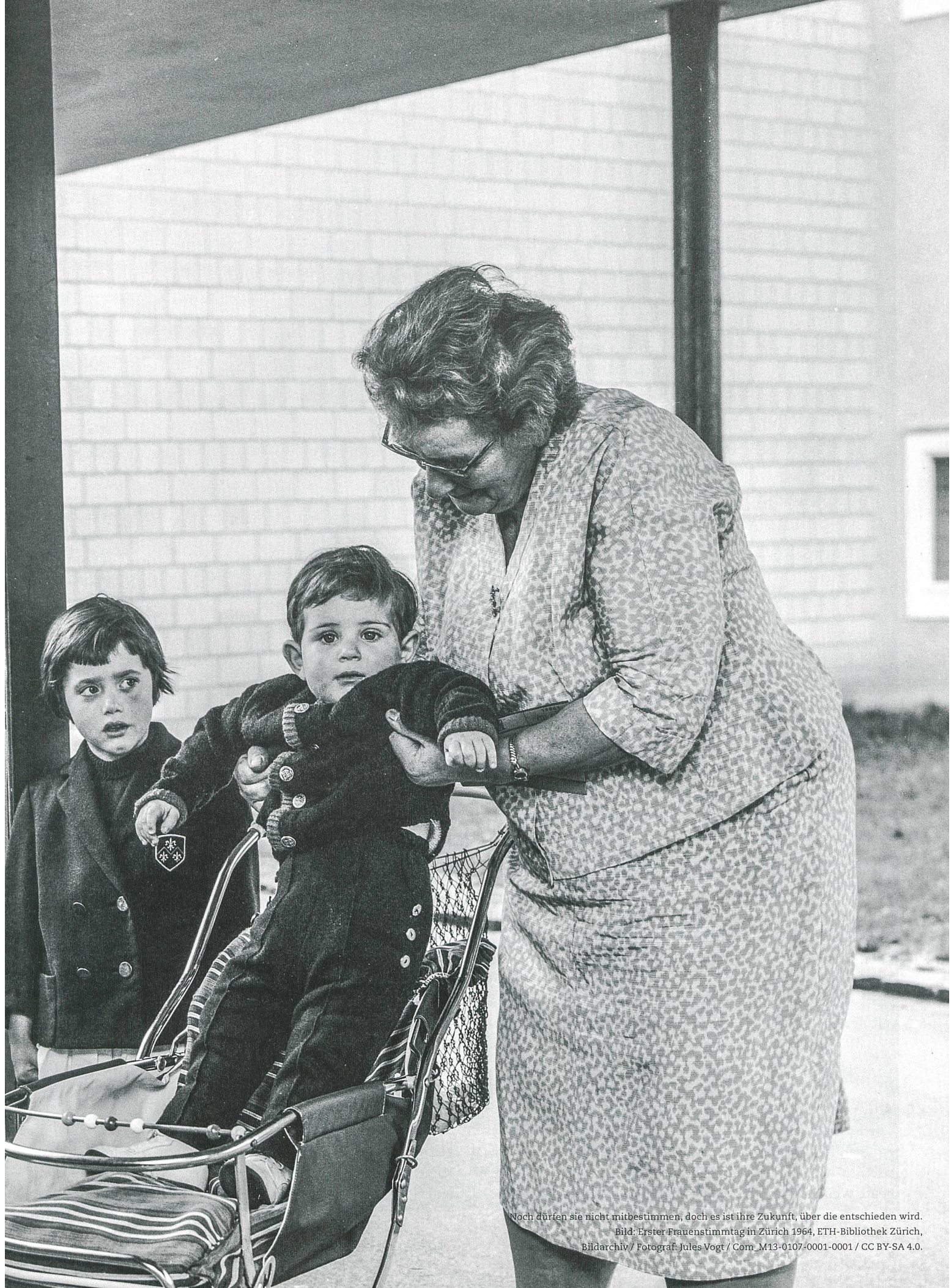
Noch dürfen sie nicht mitbestimmen, doch es ist ihre Zukunft, über die entschieden wird.